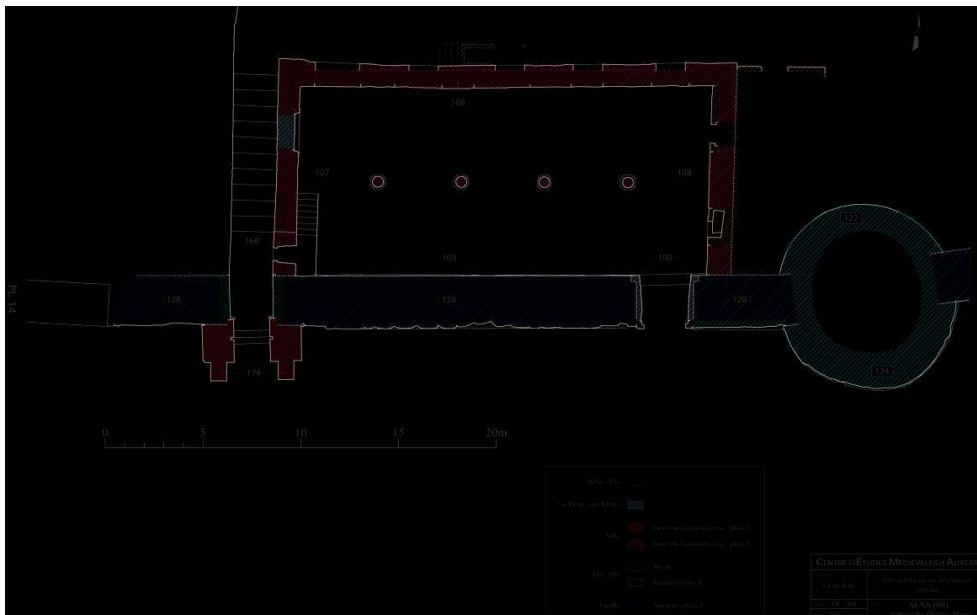
Fig. 4 – Sens. Plan du rez-de-chaussée. Phasage (CEM).