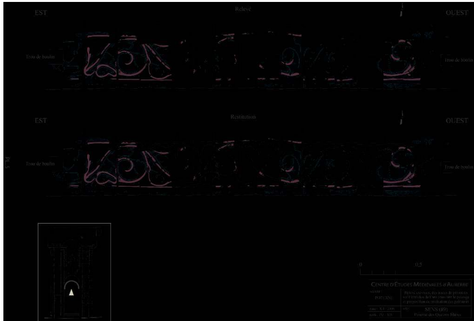
Fig. 2 – Sens. Relevé est-ouest des traces de peintures sur l'intrados de l'arc couvrant le passage. Proposition de restitution (CEM)