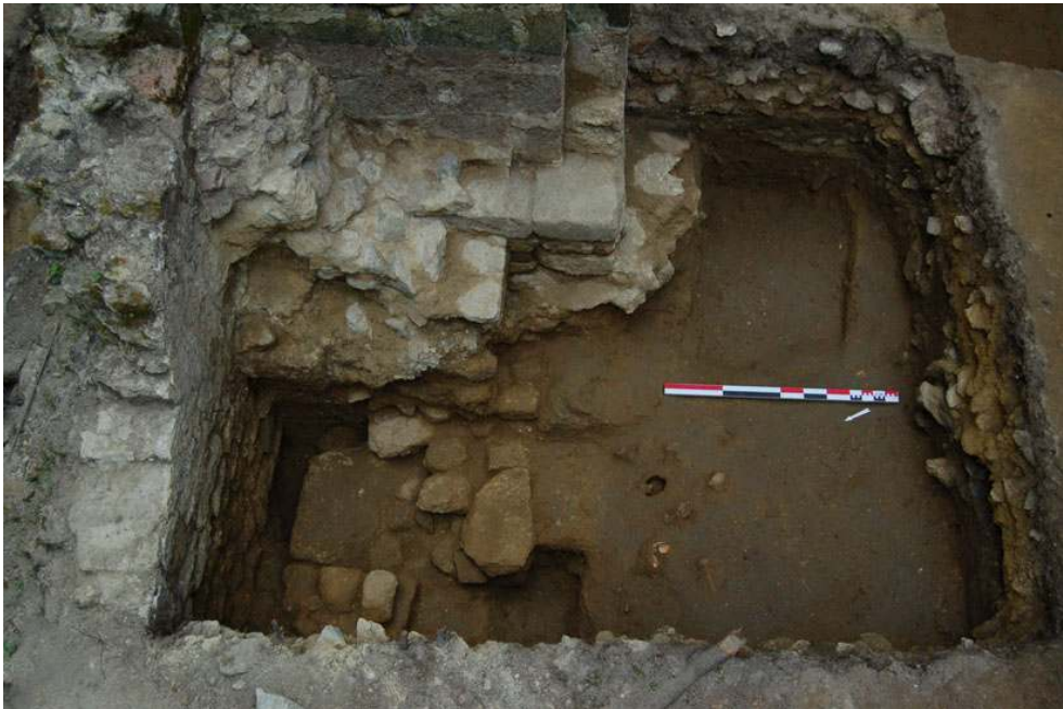
Fig. 2 - Saint-André-des-Eaux, vue de l'autel secondaire depuis l'ouest (cl. M. Dupuis).