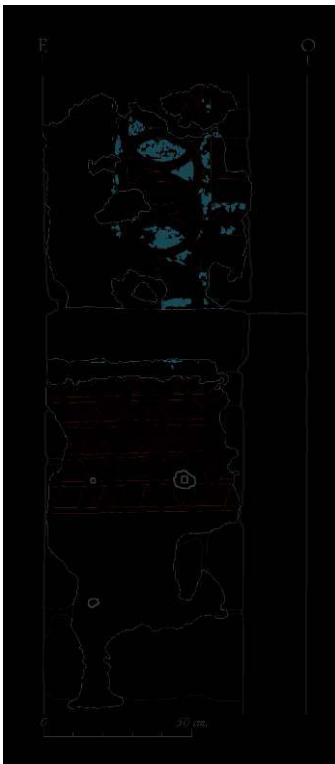
Fig. 3 - Saint-André-des-Eaux, relevé des décors peints romans sur le piédroit sur de l'arc.