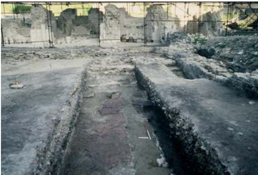
Fig. 3 – Vue de la nef de Saint-Laurent depuis la salle du chapitre vers le chevet (Ch. Arnaud).