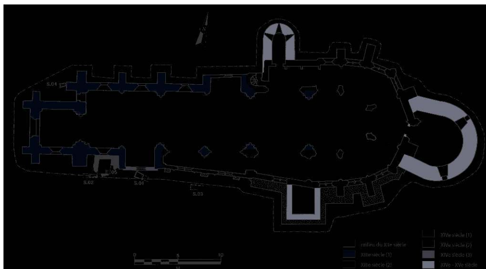
Chitry, plan de l'église avec phasage (dessin CEM, d'après plan MH).