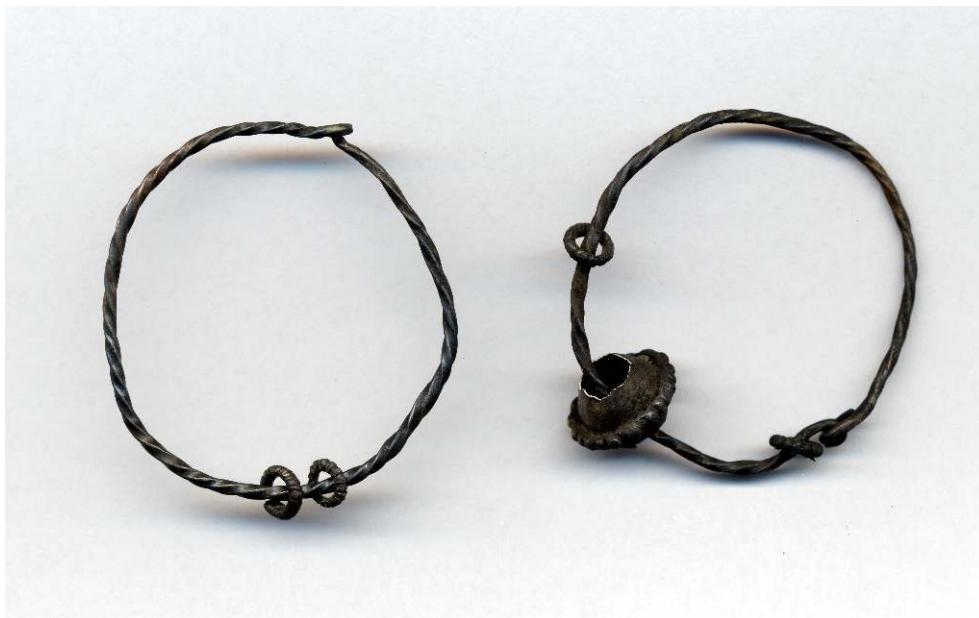
Chitry, boucles d'oreilles retrouvées en fouille.