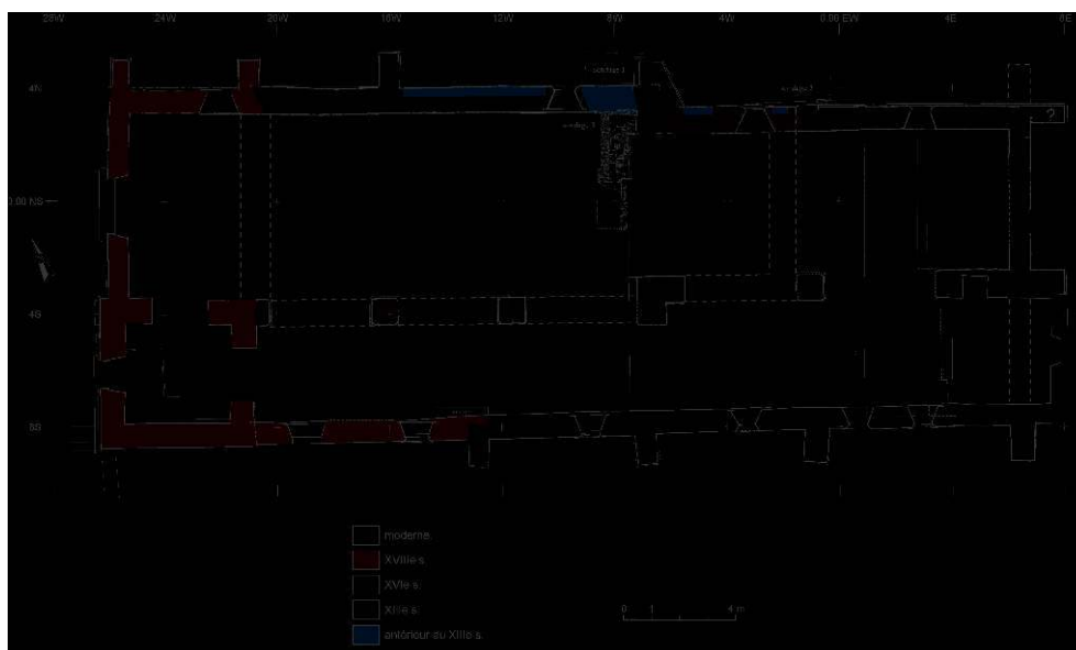
Branches, église, plan (dessin CEM).