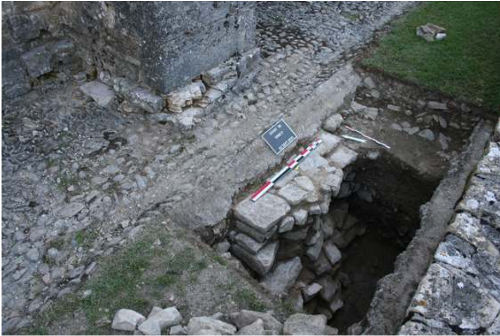
Fig. 1 – Gigny-sur-Suran, sondage 2, vue du sondage et du contrefort de l'église (CEM, 2010).