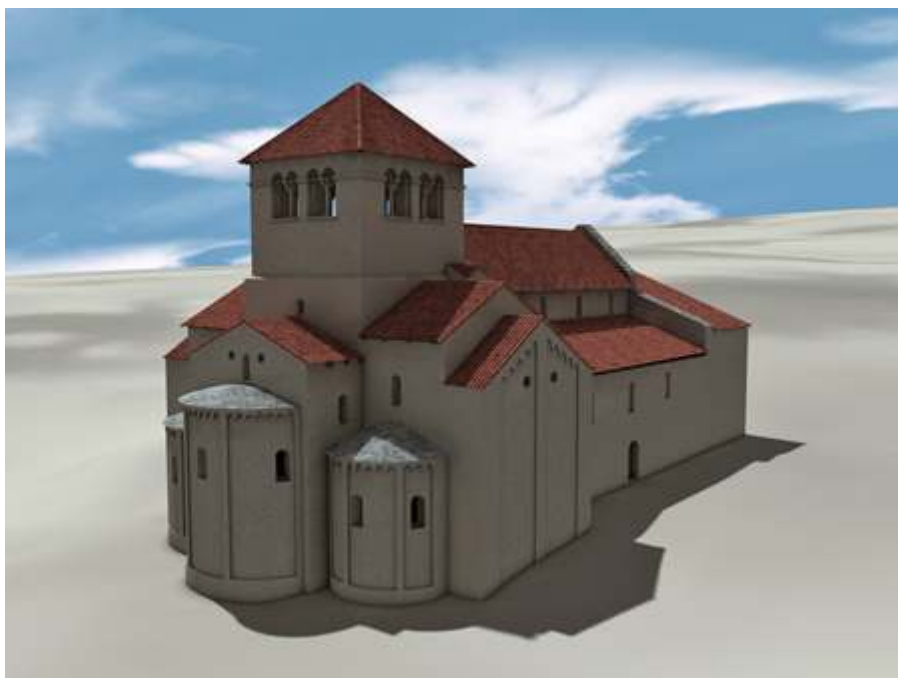
Fig. 2 - Évocation de l'église de Saint-Lupicin au XII e siècle avec la toiture à quatre pans et l'avant-nef (infographie 3D, D. Vuillermoz, APAHJ).

la nécessité d'ouvrir au-dessus d'une haute toiture. À l'appui de cette hypothèse, on avancera encore que la reconstruction de la façade au niveau des bas-côtés a pu être motivée par la nécessité de consolider, même tardivement, des maçonneries affaiblies par l'arrachement des gouttereaux de cette avant-nef potentielle. À partir des quelques éléments que nous venons d'évoquer, il reste hasardeux d'aller au-delà dans les hypothèses, et en particulier concernant la datation et l'ampleur de cet avant-corps. Il convient seulement de signaler la découverte en 1996 de deux tombes maçonnées de plan naviformes orientées nord-sud au niveau du parvis 7 . Au moment de leur découverte, nous avons suggéré que leurs positions, et en particulier leurs orientations, pouvaient trahir l'existence d'un bâtiment disparu contre lequel les tombes auraient été alignées. Une construction antérieure à l'église romane semblait alors l'hypothèse la plus vraisemblable. Mais une analyse radiocarbone engagée sur une des sépultures a donné une fourchette chronologique comprise entre les années 991-1158, avec un pic de probabilité en 1025 8 . Aujourd'hui, forts des enseignements livrés par les élévations, nous serions donc tentés de placer ces tombes en relation avec la façade de l'éventuelle avant-nef, à près de 6,80 m à l'ouest de la façade actuelle.