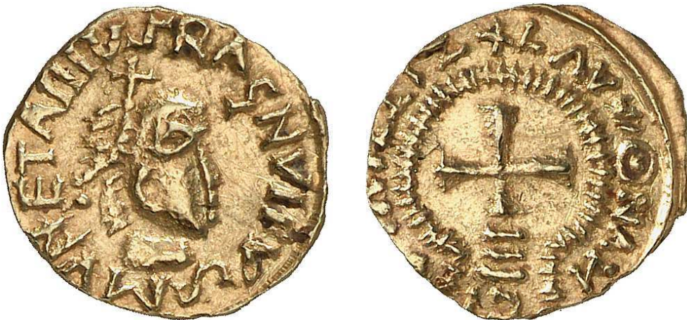
Abb. 3a-b – Triens, Lausanne, 1,21 g, 13 mm