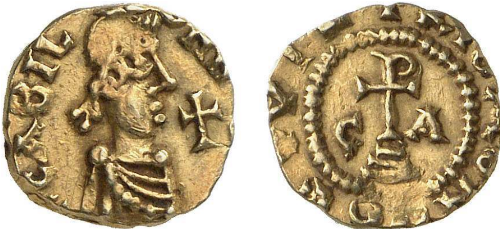
Abb. 2a-b – Triens, Chalon-sur-Saône, 1,18 g, 12 mm