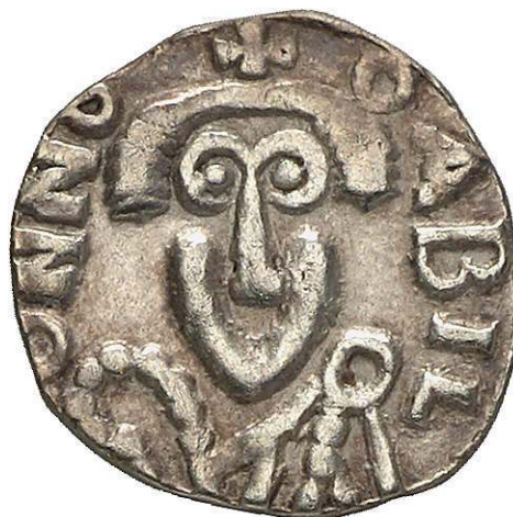
Abb. 1a-b – Triens, Chalon-sur-Saône, 1,21 g, 14 mm