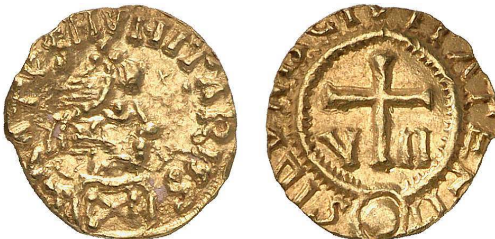
Abb. 4a-b – Triens, Sion (Valais), 1,22 g, 12 mm

GRATVS MVNITARIVS / SIDVNIS CIVETATE FIT.