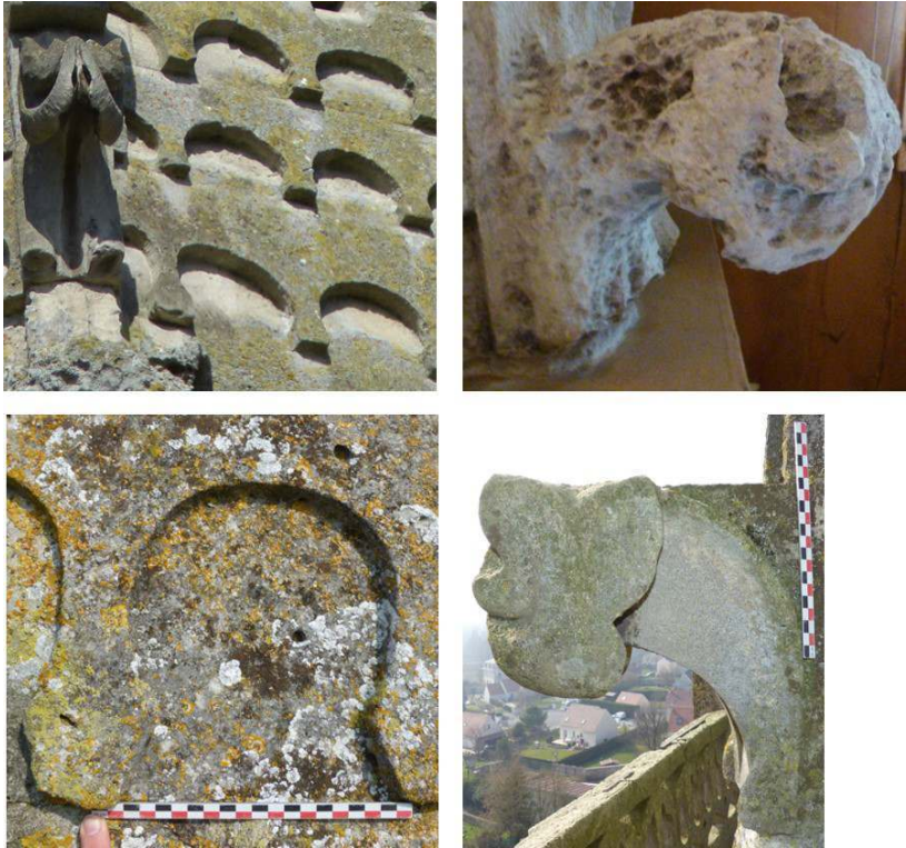
Fig. 2 – Comparaison des motifs ornementaux de la tour-clocher de la cathédrale de Senlis (en haut) et de l'église de Baron (en bas)

Lejeune évoquent le soin avec lequel les clochers des paroisses du diocèse ont suivi la mouvance architecturale et ornementale de l'église-mère (fig. 2).