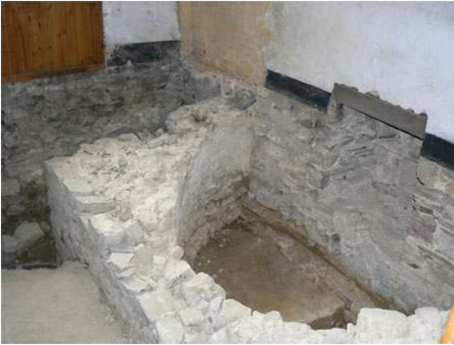
Fig. 1 - Saint-Gérard de Brogne. L'absidiole.