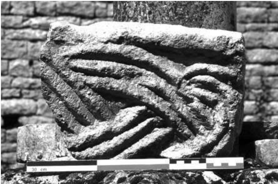
Fig. 2 – Saint-Père, église Saint-Pierre. Fragment de chancel trouvé en remploi (CEM).