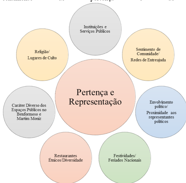
Figura 2. Mapeamento de perceções interculturais sobre fatores de impacto no sentimento de pertença e de representação