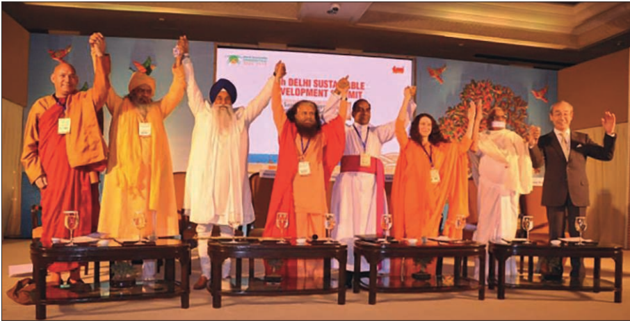
Figure 1 – Représentants religieux montrant leur unité lors du Sommet sur le Développement Durable de Delhi en 2015