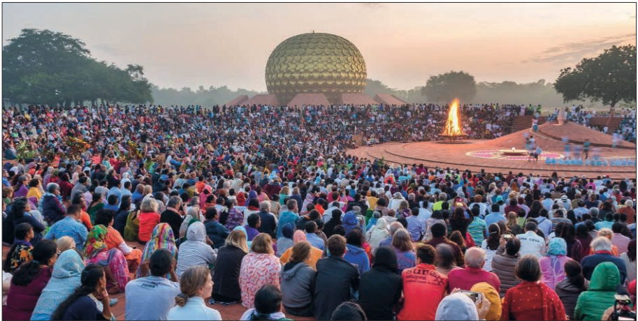
Figure 3 – Cérémonie de l'eau, Auroville, février 2018

Narendra Modi, Premier-ministre indien, Auroville, Fév. 2018.