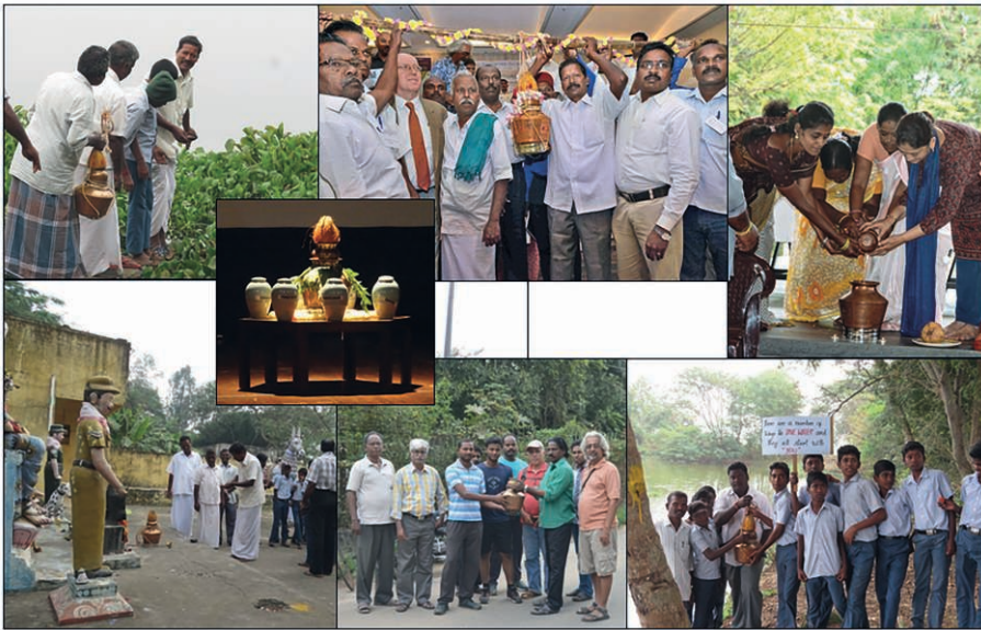
Figure 2 – Circulation du neerkudam et célébrations lors du festival de l'eau, Région de Pondichéry, 2016

eaux des sept sous-régions et à les réunir en symbole de prendre soin, relier et changer [...] Au cours de ce processus également, l'idée était de considérer l'eau comme témoin des divers événements [...] Nous avons constaté que ce liquide vital pour notre planète jouait le rôle de spectateur silencieux alors qu'il était continuellement maltraité, mal utilisé et gaspillé, sans exception dans toutes les régions [...] À moins que nous fassions de l'eau elle-même un acteur important, nous ne réussissons pas [...]. Le NeerKudam était donc le personnage central du festival, qui a non seulement été témoin de toute la chaîne des événements, mais a également rassemblé des personnes de tout horizon, des milliers d'enfants, des agriculteurs, des fonctionnaires, des diplomates comme le consul général de France, qui était également partenaire du festival, des citoyens indiens et internationaux – tous avec le beau message que l'Eau est pour tout et pour tous et qu'il est nécessaire de nous unir en oubliant nos différences, identités, castes, croyances, sexes, langues et même nationalités, à se réunir: « tous pour l'eau pour tous » (Allforwaterforall) – Rapport du festival, 2016.