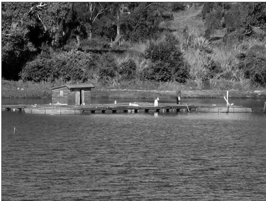
Photo 3. – Un exemple de pisciculture en cage flottante à Madagascar.

Une autre alternative, bien moins coûteuse mais nécessitant une maîtrise technique beaucoup plus importante, consiste à développer la pisciculture dans les régions proches du marché où existe déjà une filière de commercialisation. Tel est le cas de la région des Hautes Terres qui dispose de nombreux lacs pouvant être exploités par une pisciculture en cage. Celle-ci a été déjà initiée au lac Itasy et les résultats obtenus montrent sa faisabilité sur les plans technique et économique. L'acceptation sociale et l'appropriation de la technique restent toutefois à prouver.