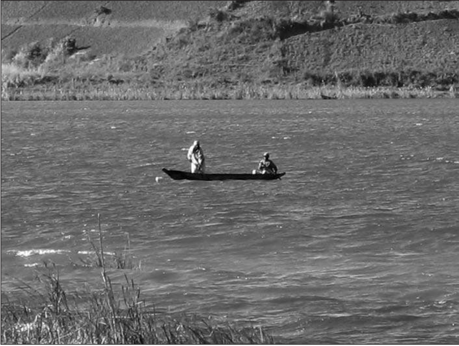
Photo 1. – Une équipe de pêche utilisant le filet maillant au lac Itasy.