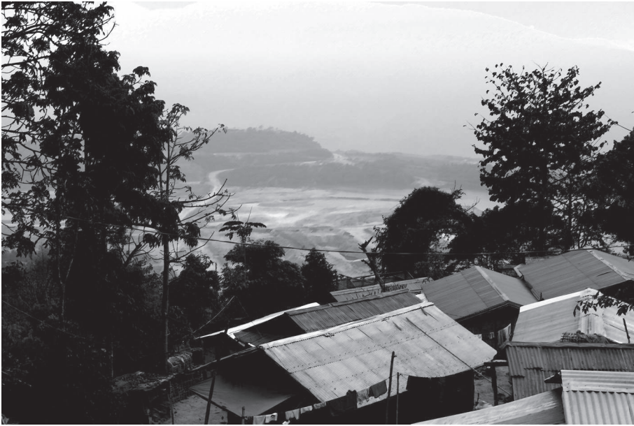
(Cliché Éric Mottet, février 2012)

de Nam Gnone – condamné à disparaître à moyen terme face à l’inexorable avancée de la mine en direction du village – par PBM et le gouvernement laotien, les vieux désirent une réimplantation sur l’ancien site du village, celui d’avant 1975, alors que les jeunes souhaitent un déplacement dans la province voisine du Boulikhamsay. Cette situation explique l’absence d’implication du village de Nam Gnone dans l’agriculture et la vente de denrées alimentaires à la mine. Pour tous, « le village est sans avenir » 33 .