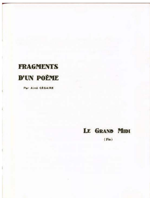
Fig. 1 Tropiques , n°2, juillet 1941