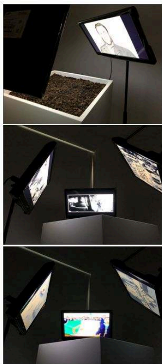
Figures 7, 8 et 9

Installation Memory of Violence de Sofiane Zouggar à Sharjah, 2018. Écrans, boîtes en bois, terre et tripodes. Dimensions variables. Installation commissionnée par Sharjah Art Foundation en collaboration avec A.R.I.A (Artist Residency in Algiers).