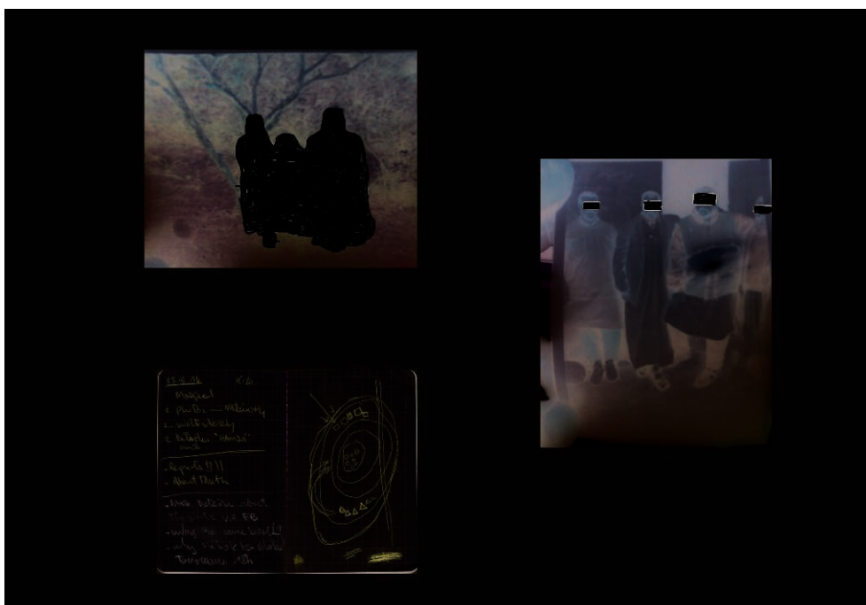
Détail. Memory of Violence de Sofiane Zouggar.