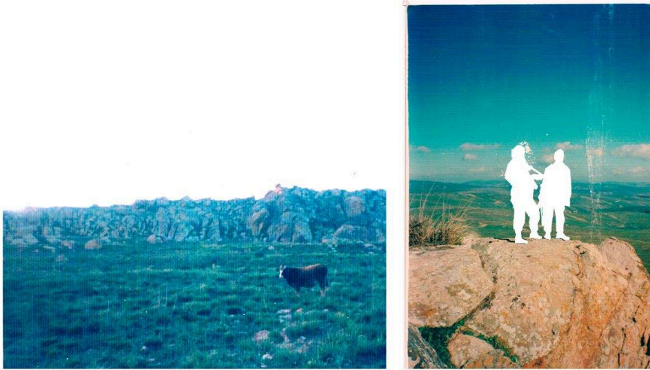
Sofiane Zouggar, les deux premiers tableaux du triptyque « Sans nom ». Impression digitale, de la série The Memory of Violence , 65 x 43 cm, 2014.