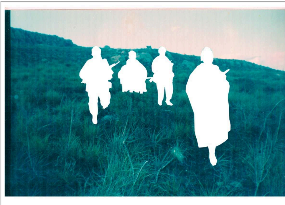
Sofiane Zouggar, troisième tableau du triptyque « Sans nom ». Impression digitale, de la série The Memory of Violence , 65 x 43 cm, 2014.

© Musée d'Art Moderne et Contemporain d'Alger