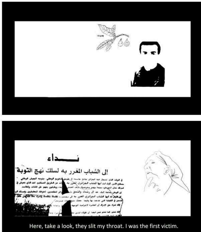
Figures 10 et 11

Dessins. Extraits de l'animation What remains (Volet de Memory of Violence ).