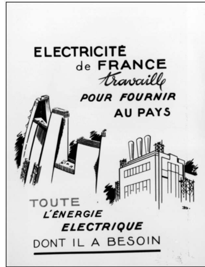
Figure 1 : Affiche EDF 1949

C'est donc le double travail d'EDF, à la fois engagée elle-même dans la reconstruction de son appareil de production et moteur de la croissance économique de la France d'après guerre, qui est représenté sur cette affiche. Dans l'ensemble, le récit qui est proposé ici laisse transparaître quelques traits