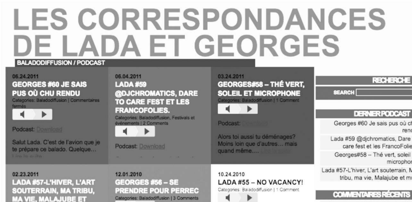
Figure 1 : Page d'accueil du podcast Lada et Georges.

Ce type de pratiques consiste à diffuser une série de contenus apparentés, mais distincts et complémentaires, sur diverses plateformes. Un cas typique sera de lancer un nouvel épisode du podcast, de l'accompagner d'un billet de blog, de photos dans Flickr ou Instagram 7 et d'un statut sur Facebook où on inscrira le lien vers le podcast ainsi qu'un commentaire personnel appréciatif, par exemple « J'aime particulièrement la chanson qui ouvre le podcast de cette semaine ». Il en résulte un enchevêtrement complexe, où pour suivre le fil d'une communication il faut savoir lire les traces laissées par les pratiques transplateformes. D'un point de vue méthodologique, mais aussi au niveau de la compréhension de ces traces, il devient périlleux d'aligner ces fragments, comme nous allons en faire la démonstration.