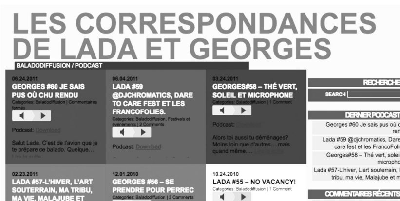
Figure 1 : Page d'accueil du podcast Lada et Georges.

Ce type de pratiques consiste à diffuser une série de contenus apparentés, mais distincts et complémentaires, sur diverses plateformes. Un cas typique sera de lancer un nouvel épisode du podcast, de l'accompagner d'un billet de blog, de photos dans Flickr ou Instagram 7 et d'un statut sur Facebook où on inscrira le lien vers le podcast ainsi qu'un commentaire personnel appréciatif, par exemple « J'aime particulièrement la chanson qui ouvre le podcast de cette semaine ». Il en résulte un enchevêtrement complexe, où pour suivre le fil d'une communication il faut savoir lire les traces laissées par les pratiques transplateformes. D'un point de vue méthodologique, mais aussi au niveau de la compréhension de ces traces, il devient périlleux d'aligner ces fragments, comme nous allons en faire la démonstration.