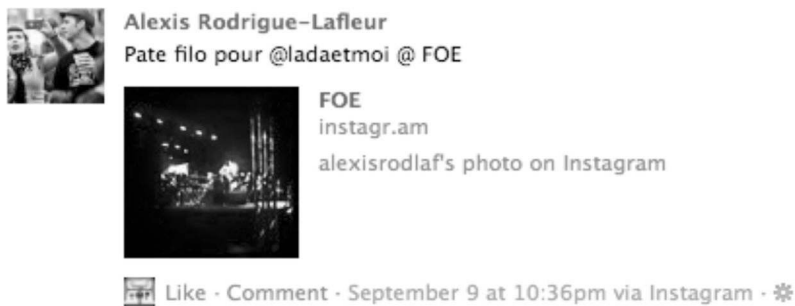
Figure 4 : Pratiques transplateformes d'Instagram à Facebook.

Cet exemple illustre une tendance que nous observons dans nos recherches quant à une convergence vers Facebook des contenus publiés par les podcasters dans les médias sociaux. Or, notre expérience d'usagère de plusieurs plateformes nous permet de penser que cette tendance gagne en popularité. Facebook « colonise » graduellement les plateformes du Web social, où il est désormais commun de retrouver le bouton bleu marqué d'un « F » témoignant de la tendance impérialiste de ce géant américain. La plupart des grandes plateformes de blogging (dont Blogger et Wordpress), de même que Twitter, Blip. fm, Instagram, Flickr et la plateforme vidéo Vimeo ont désormais un bouton de rediffusion vers Facebook. Même YouTube, pourtant l'une des possessions phares de Google, champion de l'impérialisme numérique (Proulx et Millette 2010) et principal concurrent de Facebook, a intégré le bouton bleu à sa plateforme.