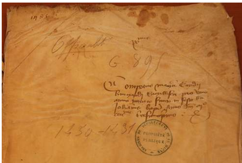
© Archives Départementales de la Marne, G895. Cliché Véronique Beaulande-Barraud