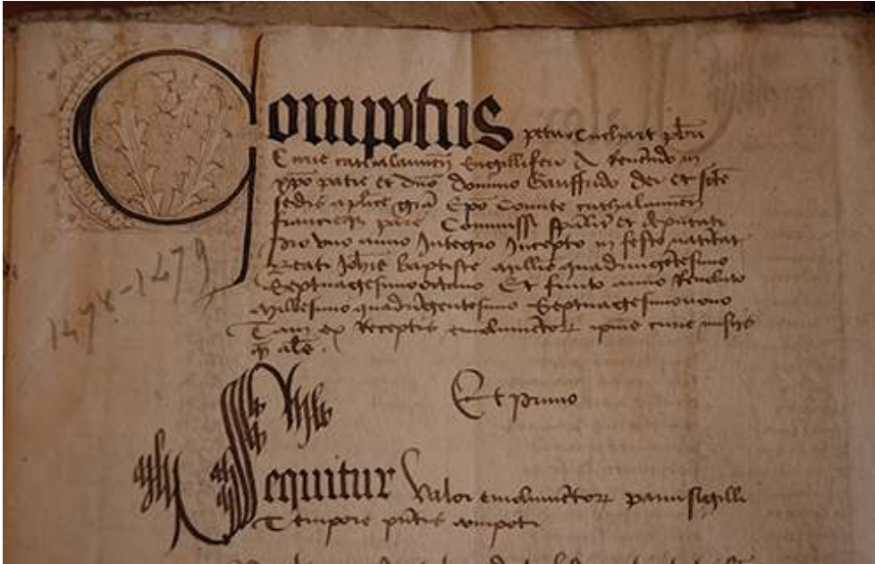
Fig. 2 G 902, fol. 1.