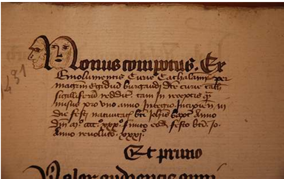
Fig. 3, G 895, fol. 1.