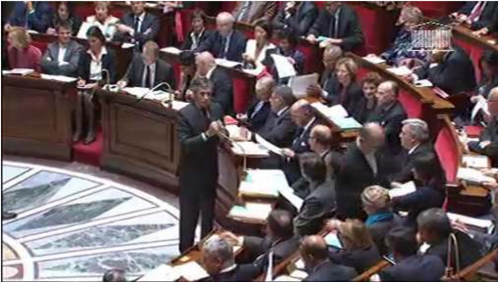
Le co(n)texte de production et d'actualisation de la réponse