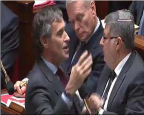
Figure 4 : l'une des formes mimogestuelles d'adresse accompagnant l'adresse dans la réponse