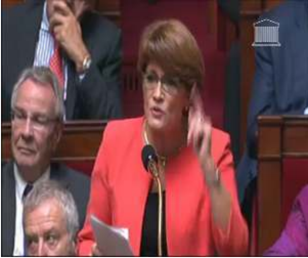
Figure 3 : l'une des formes mimogestuelles de la députée accompagnant l'adresse dans la question