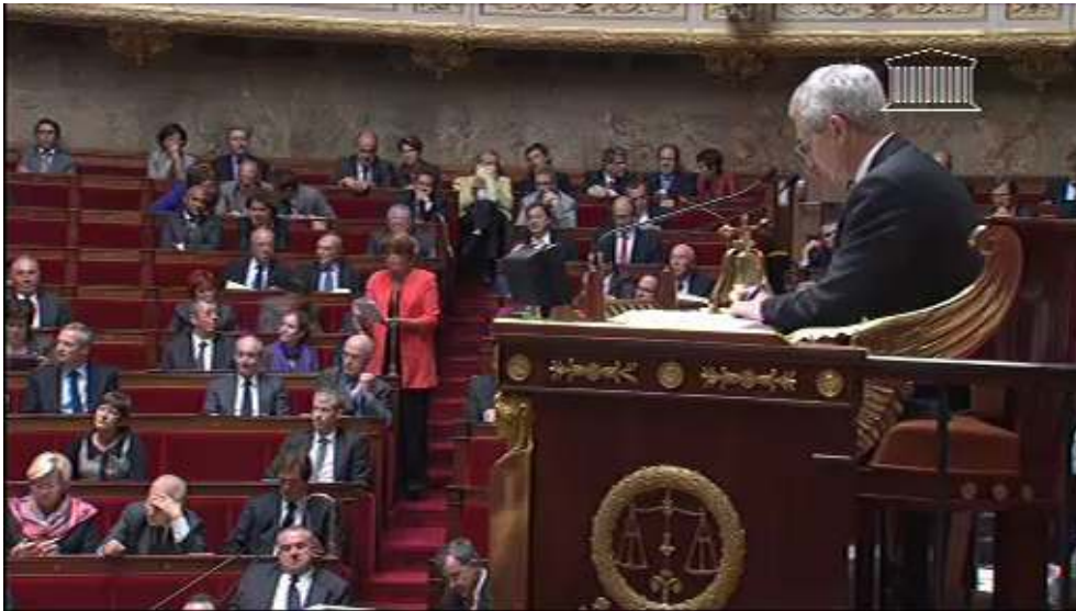
Le co(n)texte de production et d'actualisation de la question