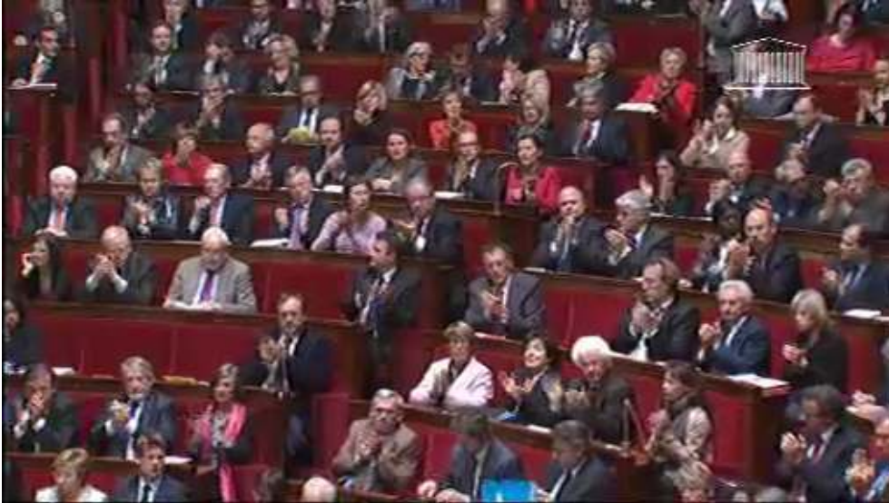
Figure 5 : L'environnement de production de la question et de la réponse : le non-verbal (les applaudissements, les cris,...)

Ainsi, tous ces éléments réunis mettent en valeur les principaux actes de langage, questionner, répondre en s'adressant directement à son coénonciateur, qui régissent le genre de discours