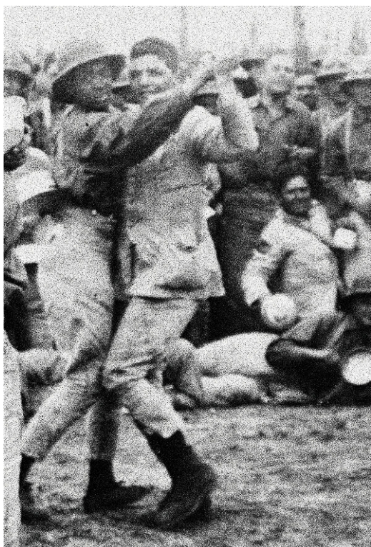
Imagen 8. “Después de las fatigas de los pesados ejercicios...” (Mendoza, 1927).