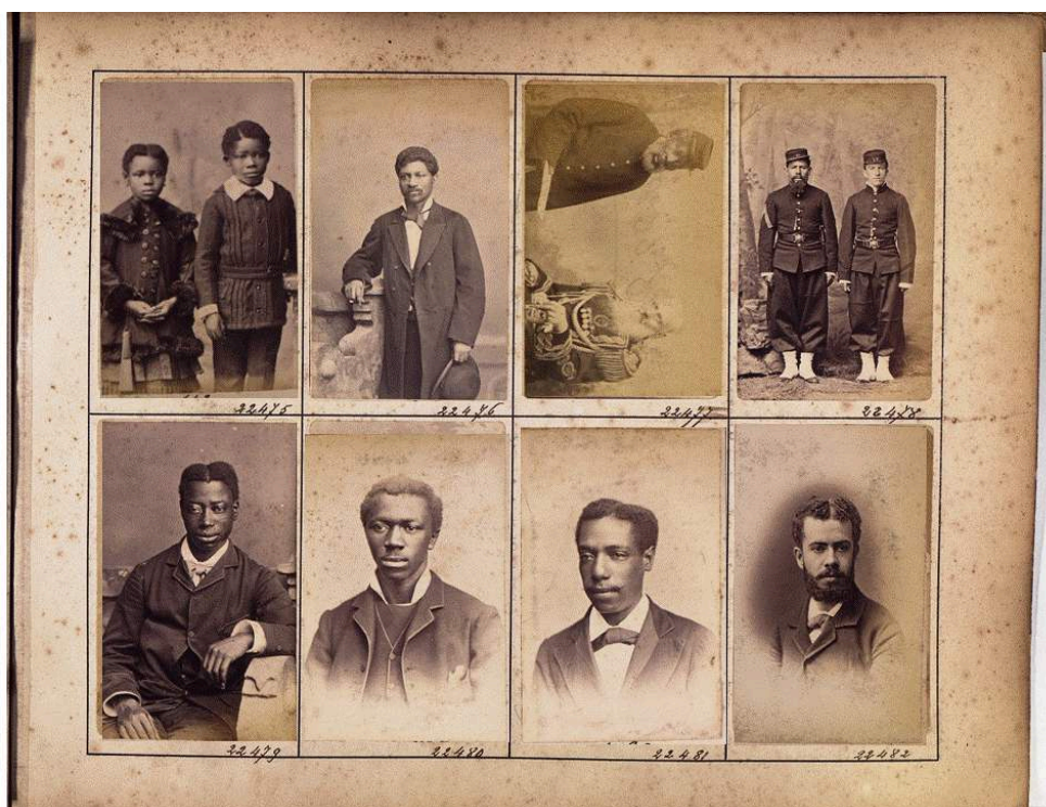
Imagen 10. Álbumes de contactos Witcomb. AGN, DDF. 9