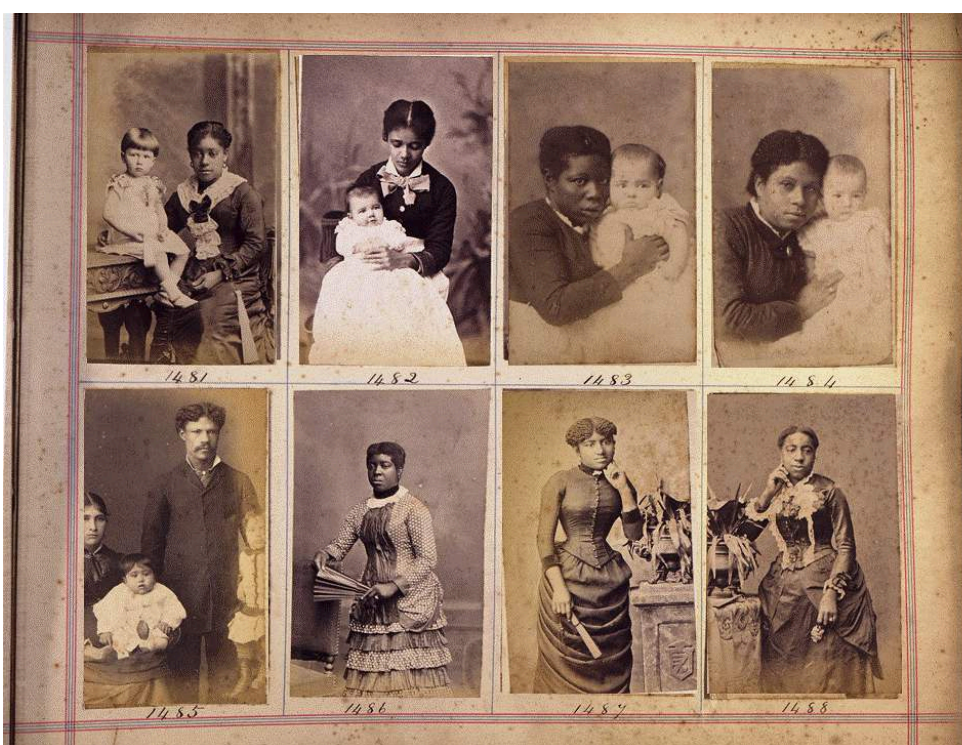
Imagen 11. Álbumes de contactos Witcomb.