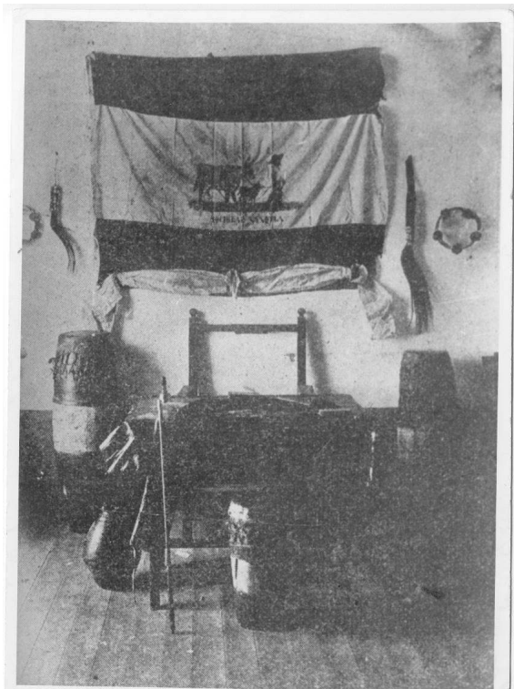
Imagen 6. “Mesa presidencial de la Sociedad de Negros Nación Benguela” (fines del s. XIX).