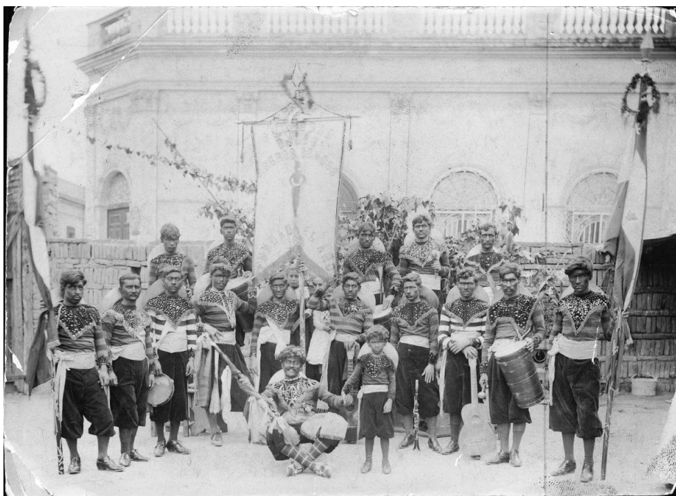
Imagen 1. "Sociedad de los negros Congos" (1891). 5 Archivo General de la Nación (AGN), Dpto. Doc. Fotográficos (DDF).