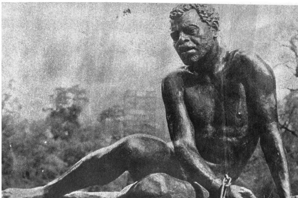
Imagen 2. "Monumento a la etnia negra" (s/f).

reproducciones de diseños interiores de buques dedicados al tráfico de esclavos (imágenes 2 y 3).