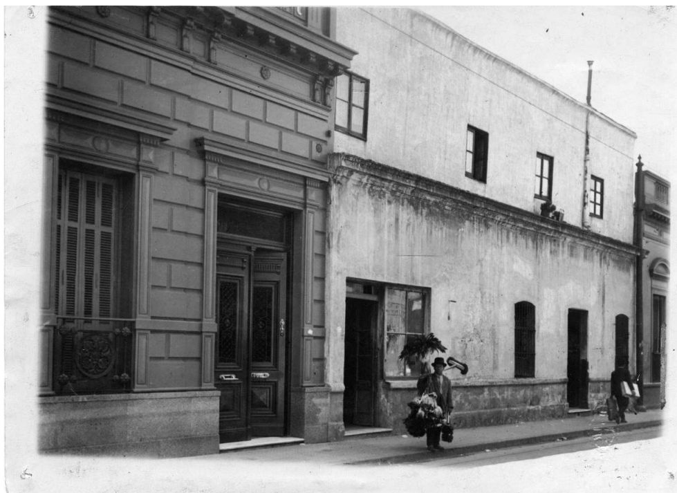
Imagen 7. "Casa Candombe de Grigera" (s/f). AGN, DDF.