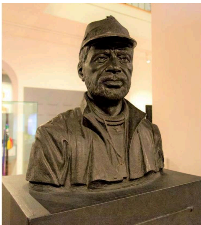
Imagen 3: Busto de Comanche 1