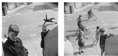
Nigel Henderson, Chiswick Road Bathnal Green , 1951. Les originaux dévoilent le front bâti de la rue contrairement aux images recadrées par Smithson afin d'éliminer tout indice de l'existant (Tate Archive, London)