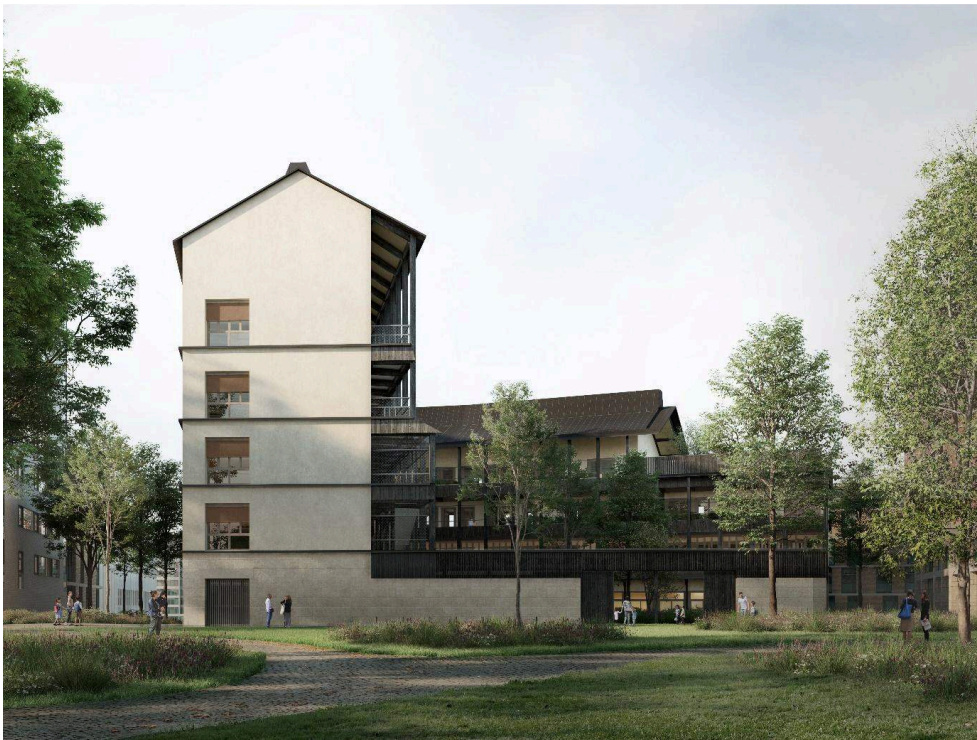
Figure 1. Perspective depuis le jardin du Charolais