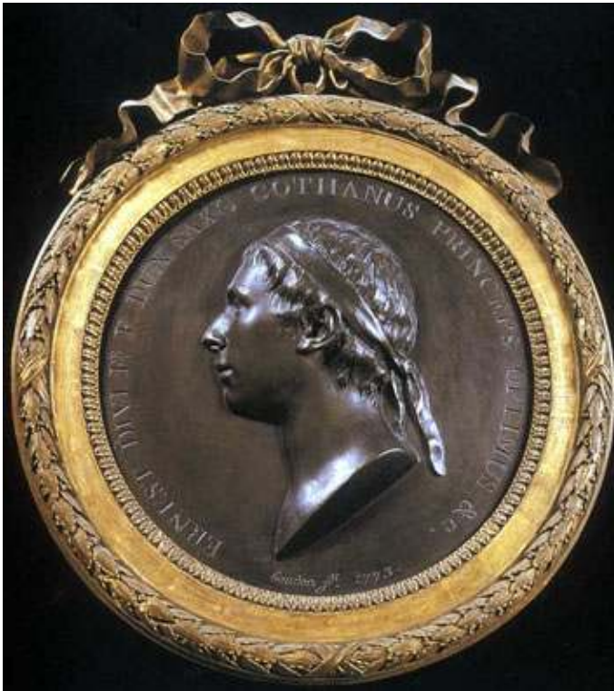
Fig. 5 : Ernest II, duc de Saxe-Gotha , 1773, médaillon, plâtre peint en couleur de bronze dans un cadre en bois doré. Gotha, Schlossmuseum, inv. P 44.