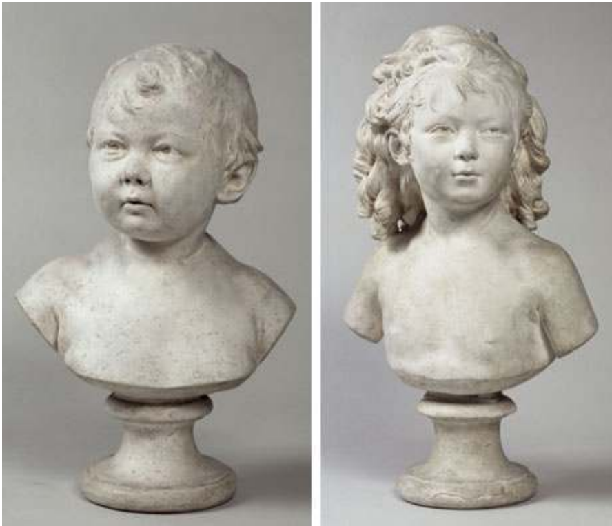
Fig. 15 et 16 : Sabine, âgée de dix mois , 1788, plâtre original. Paris, musée du Louvre, inv. RF 2452 et Sabine, âgée de quatre ans , 1791, plâtre original. Paris, musée du Louvre, inv. RF 1392.

en chacun des bustes des fillettes pointe une personnalité. Houdon donnera un dernier portrait de sa fille aînée adolescente.