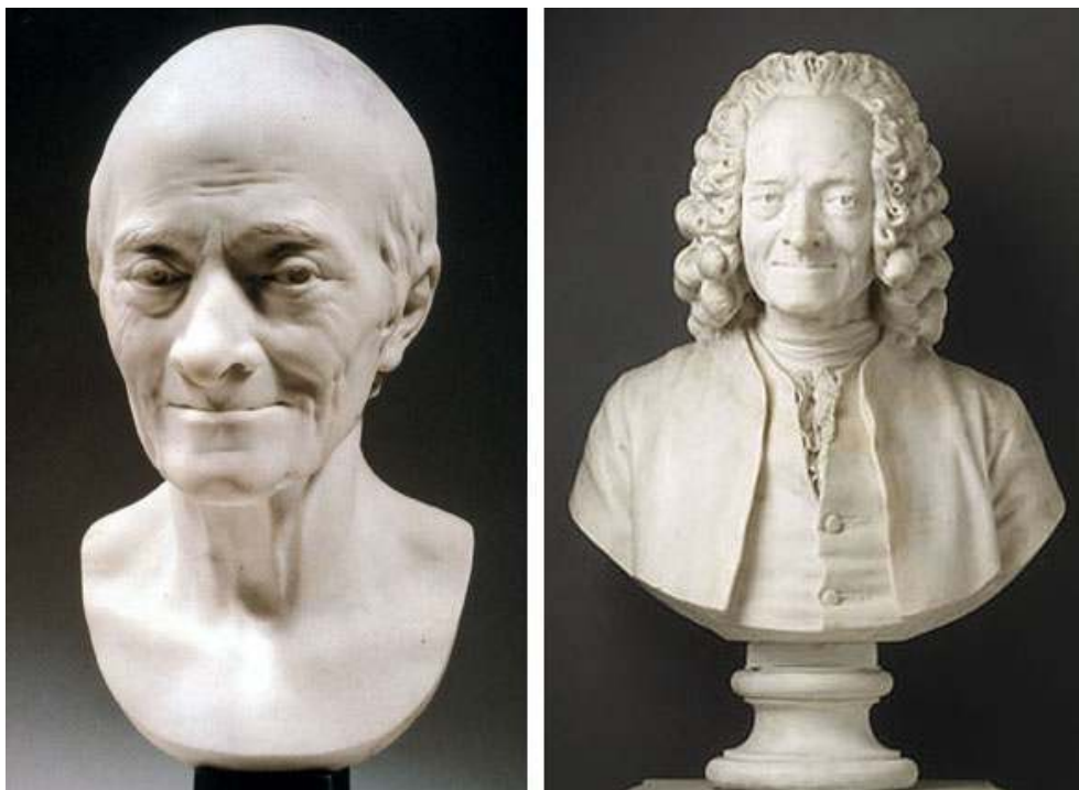
À gauche : © musée d'Angers, Pierre David À droite : © RMN / © René-Gabriel Ojéda / Thierry Le Mage

Fig. 9 et 10 : Jean-Antoine Houdon, Buste de Voltaire , 1778, marbre. Angers, musée des Beaux-Arts, inv. MBA 54 (J1881)S et Jean-Antoine Houdon, Voltaire , 1792, marbre. Château de Versailles, inv. MV 852.