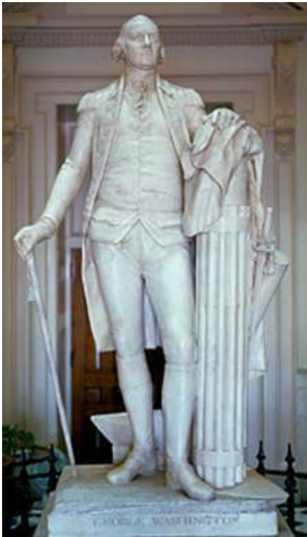
Fig. 11 : George Washington , 1792. Richmond (Virginie), Capitole.