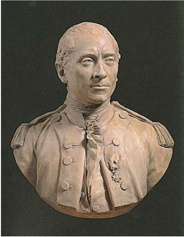
Fig. 12 : Buste de John Paul Jones, officier de marine américaine, 1780, marbre blanc. Annapolis, United States Naval Academy Museum.