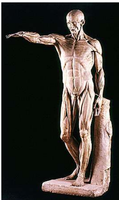
Fig. 4 : L'Écorché , 1769, plâtre blanc avec socle intégré. Rome, bibliothèque de l'Académie de France, villa Médicis, inv. 319.