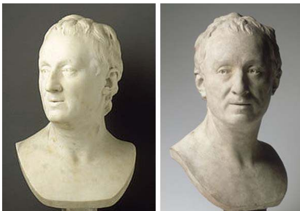
À gauche : À droite :