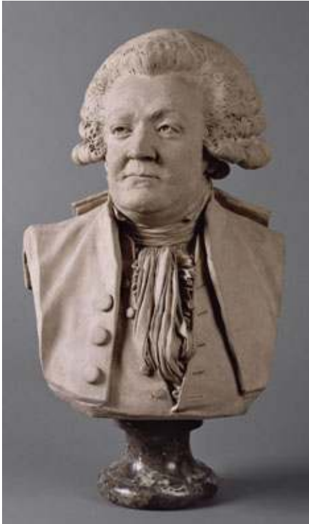
Fig. 13 : Honoré Gabriel Riqueti, comte de Mirabeau (1749-1791), 1791, terre cuite. Paris, musée du Louvre, inv. RF346.

d'évoquer au moyen d'une tête une foule, mieux encore, tout un pays qui écoute 20 ? »