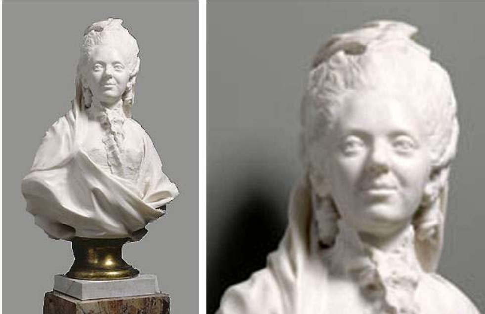
Fig. 8 : Marie-Adélaïde de France (1723-1800), dite Madame Adélaïde , troisième fille du roi Louis XV, 1777, marbre. Paris, musée du Louvre, inv. RF 2595.

de Louis XVI, exposé en 1787, il relevait d'une commande de la Compagnie des agents de change de Paris.