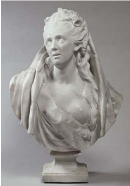
Fig. 6 : Sophie Arnould , 1775, marbre. Paris, musée du Louvre, inv. RF 2596.