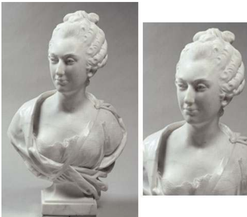
Fig. 14 : La Comtesse de Jaucourt , exposé en 1777, marbre. Paris, musée du Louvre, inv. RF 2470.