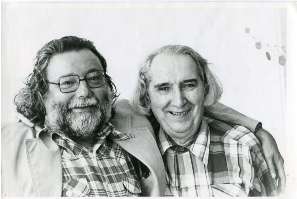
Pierre Restany et Mário Pedrosa.