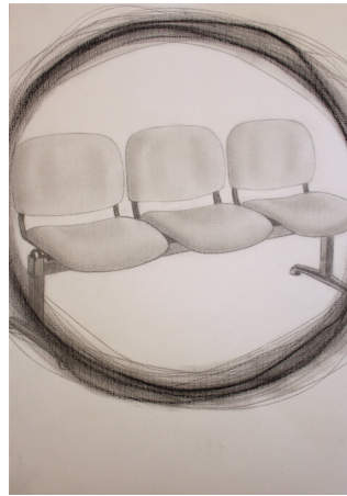
Figura 1: Eu não sou um papel! [Grafite e carvão sobre papel]