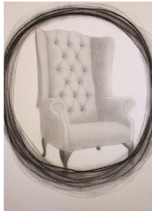
Figura 7: Eu quero viver tudo, experimentar tudo! [Grafite e carvão sobre papel]