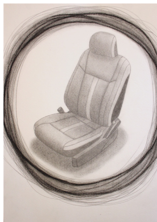
Figura 3: Dez minutos de espernear e gritar [Grafite e carvão sobre papel]

Houve ali aqueles 10 minutos de espernear dentro de um carro fechado, de espernear e gritar... porquê? Depois paras e respiras... Eu sei muito bem porquê! Há aquele momento de raiva e de questionamento, mas a causa para mim estava muito bem localizada. Eu tenho uma mutação genética. Toda essa explicação científica permitiu-me sossegar e não andar à procura de nenhuma outra.