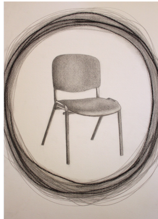
Figura 2: O pior é a espera! [Grafite e carvão sobre papel]

Fonte: Susana de Noronha e Alexandra Silva (2017)