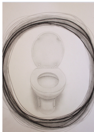
Figura 5: Dignidade... tentar limpar [Grafite e carvão sobre papel]