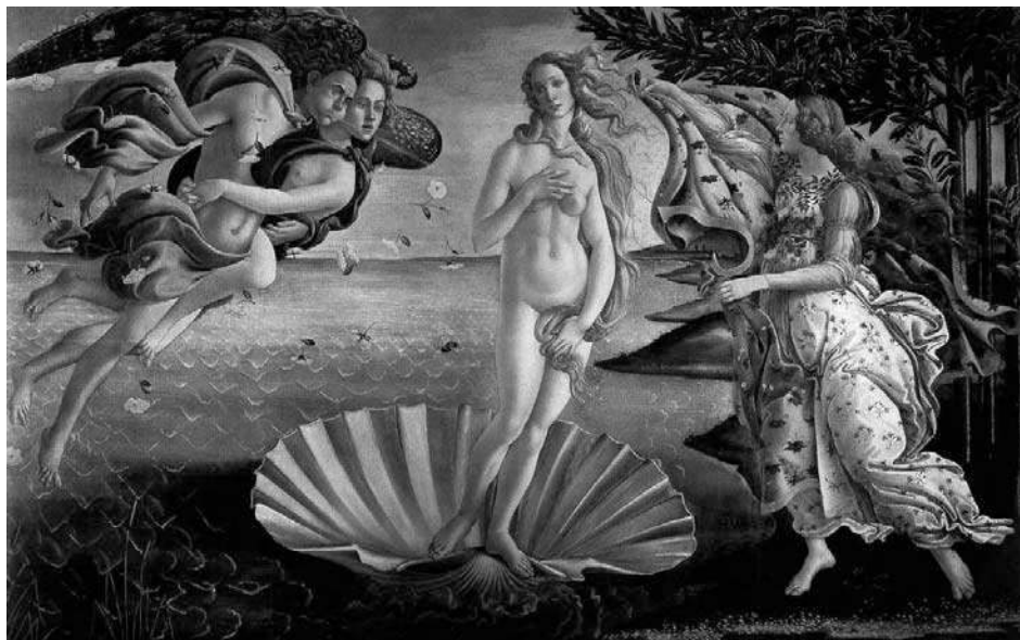
“Nascimento de Vénus” (têmpera sobre tela, 2,78x1,72)

sujeito masculino, à eterna sujeição da mulher – mero troféu de caça do cavaleiro – ao forçado matrimónio.