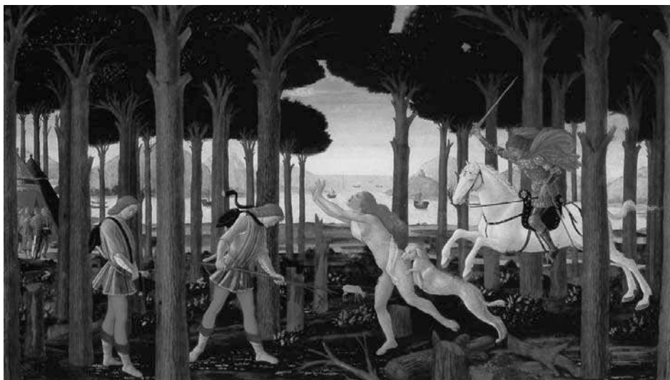
1. “O encontro com os amaldiçoados no pinhal” (1,38x0,83)

A partir desta narrativa boccacciana sobre a eterna condição feminina na sociedade medieval e a sua completa passividade perante a decisão masculina, verificamos como a obra de arte se torna assim um modelo pedagógico bastante persuasivo: procura “domesticar” a conduta irracional da mulher, de modo a que ela possa satisfazer todas as necessidades do homem, em detrimento da sua própria liberdade de escolha.