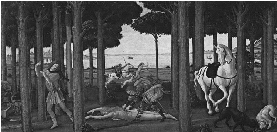
2. “A caçada infernal” (1,38x0,83)

2. “A Caçada Infernal” caracteriza-se sobretudo pela sua chocante crueldade e está dividida em três tempos sequenciais: no plano mais central, o cavaleiro esventra a jovem, que jaz morta no chão, e arranca-lhe o coração pelas costas, enquanto, do lado esquerdo, o horrorizado Nastagio assiste passivamente a tudo; ao canto inferior direito, um cão preto e outro branco disputam entre si o coração que o cavaleiro, entretanto, lhes arremessou; ao fundo, a cena volta ao início, estando o cavaleiro já montado no seu cavalo branco, com a sua espada desembainhada, a perseguir outra vez a dama nua, outra vez renascida;