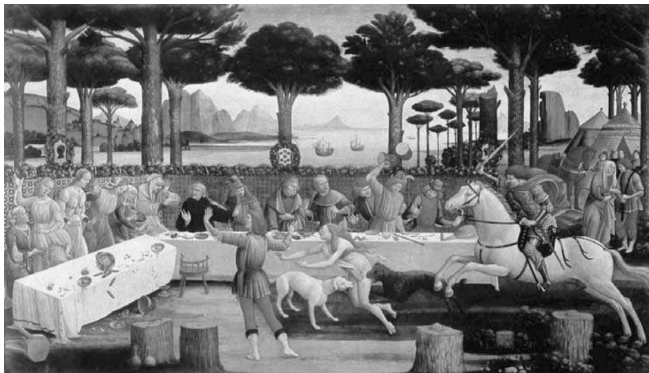
3. "O banquete no pinhal" (1,42x0,83)

3. "O banquete no pinhal" representa as damas separadas dos convidados masculinos, segundo as regras vigentes da etiqueta social (damas à esquerda, e cavalheiros à direita), estando todos alinhados ao longo da enorme mesa do banquete preparado por Nastagio, e para o qual convidou os familiares nobres da sua amada, caracterizados pelo seu vestuário festivo e multicolor. A perseguição com consequências trágicas ocorrida no quadro anterior é repetida mesmo à frente de todos, e desta vez ainda com maior intensidade, pois as nádegas da dama nua são agora mordidas em simultâneo por ambos os cães, um duplo símbolo por excelência da fidelidade "canina", isto é, da extrema lealdade. Perante uma cena tão macabra, que deixa os convivas em total estado de alvoroço e grande inquietação, o protagonista ergue os braços para os acalmar e, já em pleno domínio da situação, interpreta-lhes a cena que acabam de presenciar;