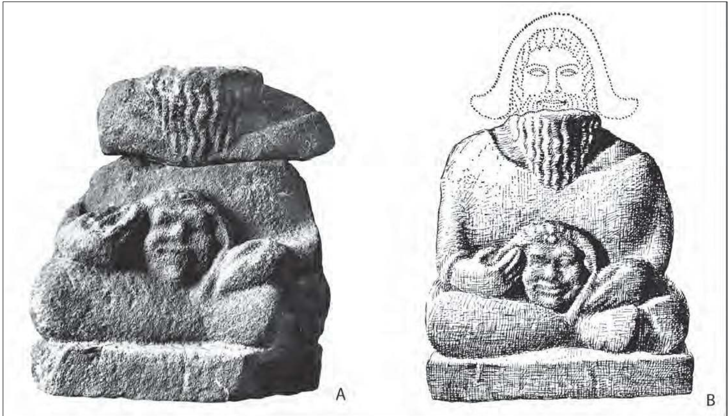
■ 2 Statue en ronde-bosse provenant de Bourrière (Aude) (d'après Arcelin, Dedet, Schwaller 1992). Hauteur actuelle : 0,55 m. A : les éléments conservés au Musée de Limoux (cl. : G. Barruol, U. Gibert et G. Rancoule) ; B : reconstitution avec la tête, perdue après la découverte (dessin : N. Calabro).

insertions musculaires puissantes, a plus de chances d'appartenir à un homme, et un crâne gracile à une femme. En tous cas, des études ostéologiques récentes sur plusieurs sites vont dans ce sens. C'est le cas à Entremont pour les crânes découverts par F. Benoît dans le sanctuaire de la seconde moitié du II e s. av. J.-C., qui sont très majoritairement robustes (Mahieu 1998, 62-64). Les deux crânes provenant d'une porte de l'oppidum de La Cloche près de l'étang de Berre, datée de la première moitié du I er s. av. J.-C., appartiennent aussi à des adultes robustes (Mahieu 1998, 64-65). Des deux crânes également découverts à l'entrée de l'oppidum de Buffe Arnaud dans les Préalpes de Provence, l'un signale un adolescent ou un adulte très robuste, tandis que l'autre marque un adulte moins robuste, tous deux exposés là vers la fin du II e s. av. J.-C. (Duday in Garcia, Bernard 1995, dossier e). Les crânes exposés, à l'exclusion de toute autre partie du corps, au bord du rempart de l'habitat gardois du Cailar, sans doute près de la porte au III e s. av. J.-C., appartiennent toujours à des sujets de taille adulte et deux arguments sont en faveur d'individus masculins, leur morphologie souvent robuste et l'accompagnement de nombreuses armes (Roure et al. 2011, 148-149). Également, à la même époque en Catalogne, sur l'oppidum du Puig de Sant Andreu à Ullastret