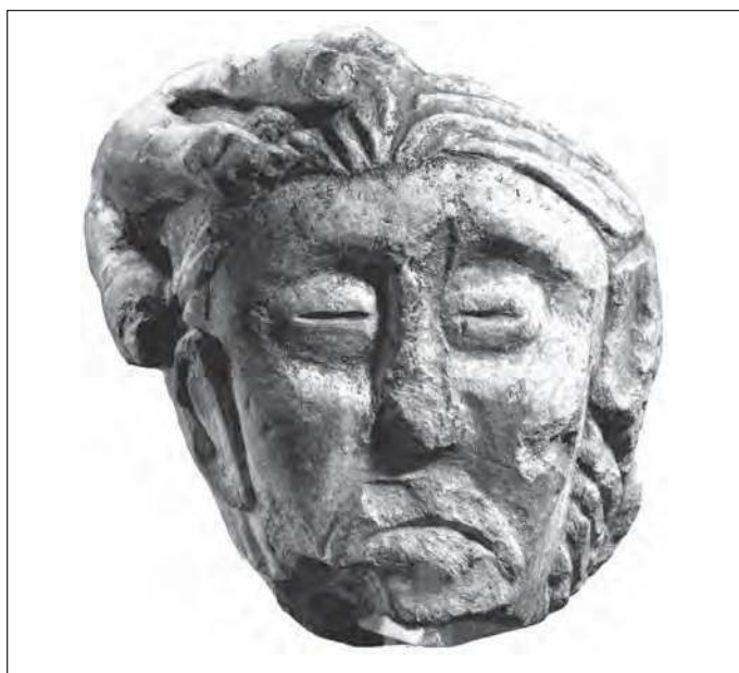
■ 1 Tête coupée en ronde bosse n° 27 de l'oppidum d'Entremont (Bouches-du-Rhône) (d'après Arcelin, Dedet, Schwaller 1992). Hauteur : 0,23 m.