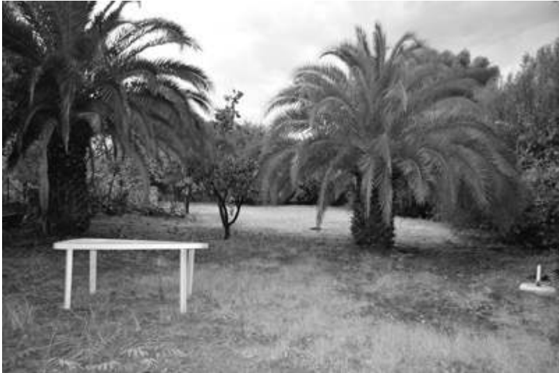
Pauline Le Boulba