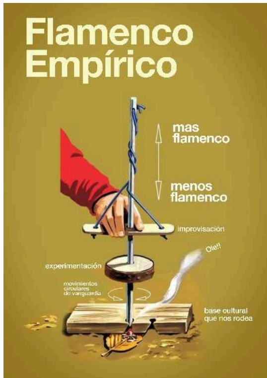
Flamenco Empírico, artwork, mars 2016