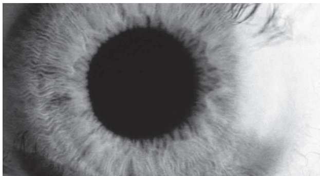
Psycho (Gus Van Sant, USA, 1998)

sans doute une certaine idée du cinéma : Araki, Clark, Caouette ou encore, pourquoi pas ?, Haneke. Parfois peintres, photographes ou vidéastes, tous, en effet, pensent le cinéma au regard d'autres types d'images (au gré de leurs affinités particulières) : photographiques, d'animation, de jeu vidéo, de vidéo, de super-8, de vidéo surveillance ou de téléphones mobiles. Et c'est bien de cela dont il est largement question dans Elephant de Gus Van Sant, un film où, d'entrée de jeu, la photographie rencontre le cinéma, où, ailleurs, la fiction (en couleur) croise le documentaire historique télévisuel (en noir et blanc), où, enfin, le jeu vidéo semble largement déterminer des choix de mise en scène. L'omniprésence d'une caméra qui, à l'instar des deux jeunes meurtriers face à leur ordinateur ou dans leur école, traque les personnages de dos dans le dédale des couloirs du lycée, la place assignée au spectateur dans