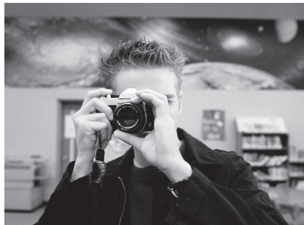
La photographie : To Die For ( Prête à tout , 1995) et Elephant (2003)

ces dispositifs distincts mais aussi l'enchevêtrement de quelques régimes d'images (photographie, cinéma, jeu vidéo, documentaire) constituent les indices que Van Sant, en proposant une expérience cinématographique singulière, s'inquiète de l'indétermination de ces images, de leurs combinaisons et de la contamination des unes par les autres.