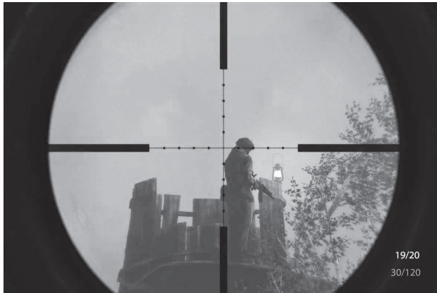
Medal of Honor (Tobias Strömwall, 2010)