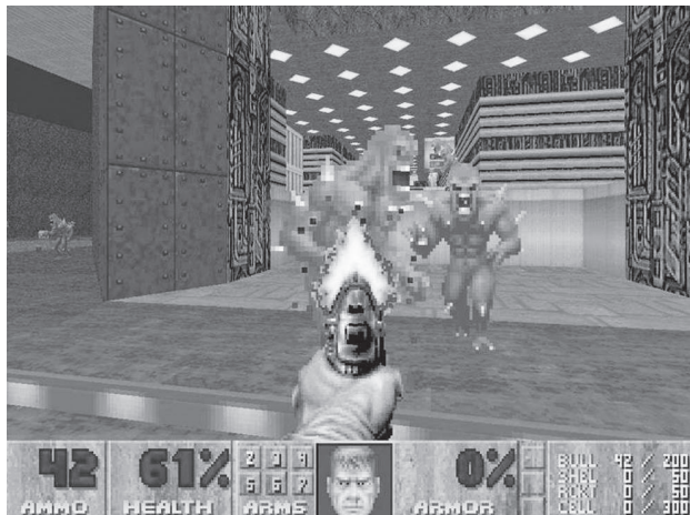
Doom (id Software, 2003)

deux adolescents, qui massacre le morceau Für Elise . La caméra pivote à 360° jusqu'à l'entrée de son complice, qui s'installe sur le lit pour jouer à l'ordinateur. Ce qui saute aux yeux, c'est d'abord la présence et le mouvement de la caméra dans cet espace réduit, confiné, en sous-sol, presque clos (une fenêtre-soupirail, une porte), qui tourne lentement dans la pièce pour se retrouver dans le dos du pianiste. Ce déplacement est d'autant plus remarquable qu'il correspond au point de vue que porte le joueur, immédiatement après, sur les personnages de son jeu, qu'il abat les uns après les autres. La position de la caméra dans le dos du pianiste est exactement celle de l'arme automatique dans le jeu vidéo. Ces images annoncent celles du carnage et renvoient à la fois au point de vue du joueur (qui se confond donc avec celui des personnages quand ils révisent leur plan de bataille) et à celui du spectateur d' Elephant qui suit les déambulations des tueurs ou des victimes filmés de dos dans les couloirs du lycée. Dans cette courte scène, ce sont bien deux points de vue – celui du joueur et celui du spectateur – qui se télescopent, qui se recoupent mais qui restent néanmoins bien distincts.