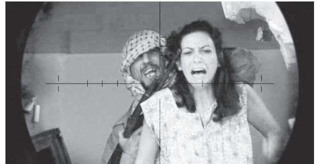
Lebanon (Samuel Maoz, 2010)

(y compris autour des deux adolescents tueurs), elle se distingue tout aussi ostensiblement du dispositif ludique pour redire la singularité de la place du spectateur dans le dispositif cinématographique. Soulignant d'un côté une proximité, Elephant dit bien l'écart entre les places respectives des spectateurs de cinéma et des joueurs de jeux vidéo – et donc les particularités respectives de deux dispositifs proches et lointains.