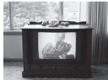
Elephant et les autres images