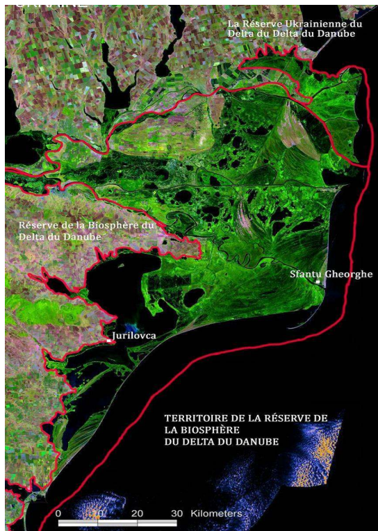
Figure 1. Carte du delta du Danube