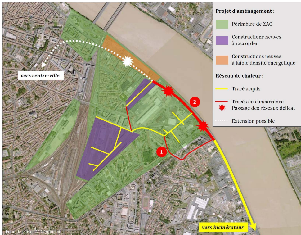
Figure 2. Deux tracés du réseau sont en concurrence : le premier représente un optimum de court terme, mais seul le second préserve la possibilité d'une extension au centre-ville