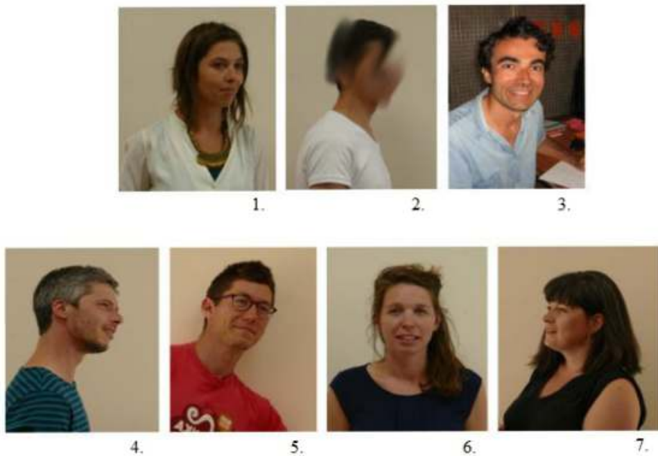
Figure1. L'équipe de la recherche-crédation