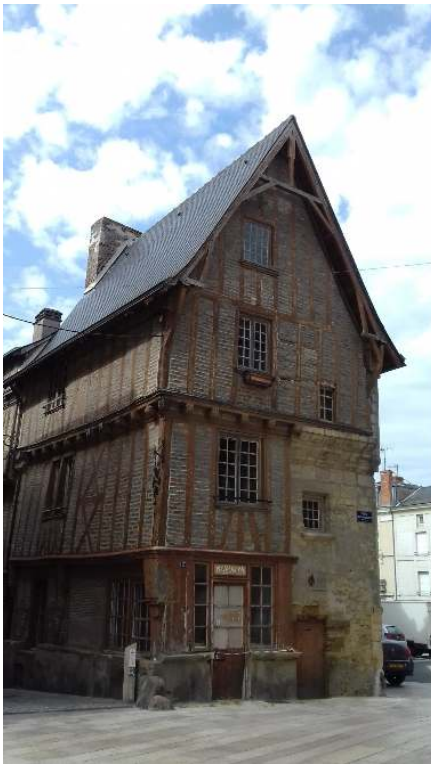
Figure 3. Thouars en images