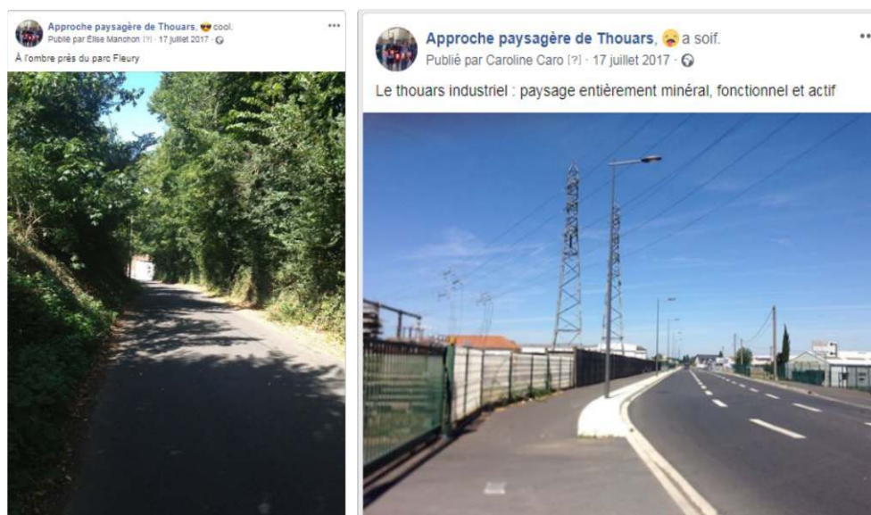
Figure 5. Page Facebook des paysages de Thouars

https://www.facebook.com/Approche-paysag%C3%A8re-de-Thouars-1895425257385461/