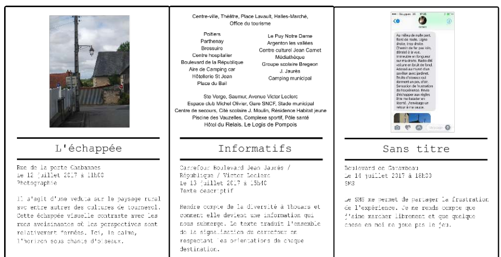
Figure 4. La diversité des captures, une traduction de la diversité des paysages

L'image à gauche donne à voir une capture réalisée à partir d'une photographie, il s'agit d'une fenêtre sur le paysage rural depuis le centre-ville. La capture au centre retranscrit par un texte l'ensemble de la signalétique présente sur un même carrefour. Enfin, l'image de droite montre une capture d'un lieu effectuée à partir d'un SMS. Le SMS permet de partager un sentiment personnel face à une situation paysagère à l'instant t.