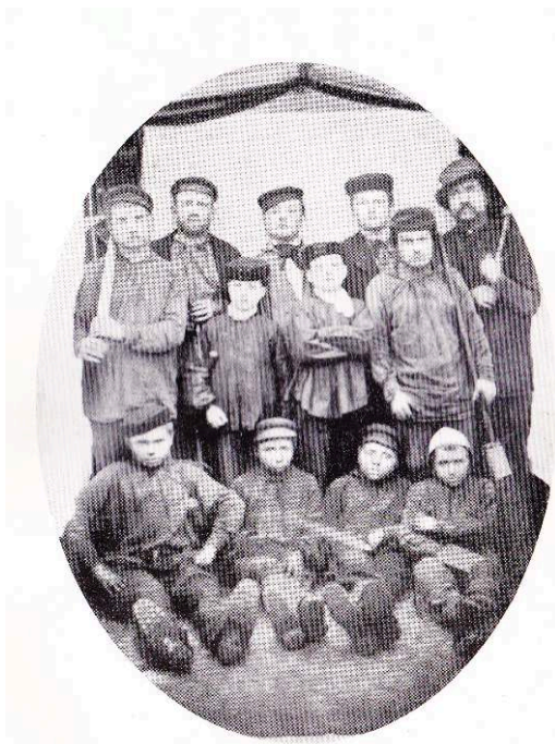
Le petit ramoneur — 1871 le premier, à gauche du rang inférieur.

Archives dominicaines de la Province de France/Tangi Cavalin, Nathalie Viet-Depaule (dir.), Dictionnaire biographique des frères prêcheurs en ligne.