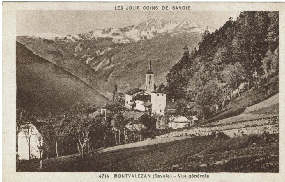
Archives dominicaines de la Province de France/Tangi Cavalin, Nathalie Viet-Depaule (dir.), Dictionnaire biographique des frères prêcheurs en ligne.