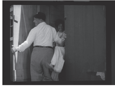
Fig. 2 et 3 – Madame porte la culotte , George Cukor, 1949.

en l'humanité de Joe accomplit le programme esthétique d'hybridation visuelle pour lequel Willis O'Brien, assisté par Ray Harryhausen, a été oscarisé en 1949. L'effet spécial de la figurine trouve finalement sa forme la plus aboutie dans l'effet amateur du jeu du personnage qu'elle représente.