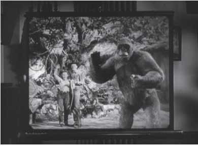
Fig. 1 – Monsieur Joe , Ernest B. Schoedsack, 1949.