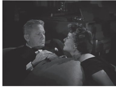
Fig. 8 et 9 – Une analogie formelle du film amateur au salon des Bonner.

l'allure onirique du film. Pour Marie-Thérèse Journot, si le film amateur injecte de la narration faisant partie des attendus classiques, il peut être « au deuxième degré [...] assimilable au rêve » : « grâce à la banalité du scénario, à l'absence totale d'événements, l'attention peut flotter et ne retenir qu'un signifié global, purement symbolique » 17 (fig. 8 et 9).