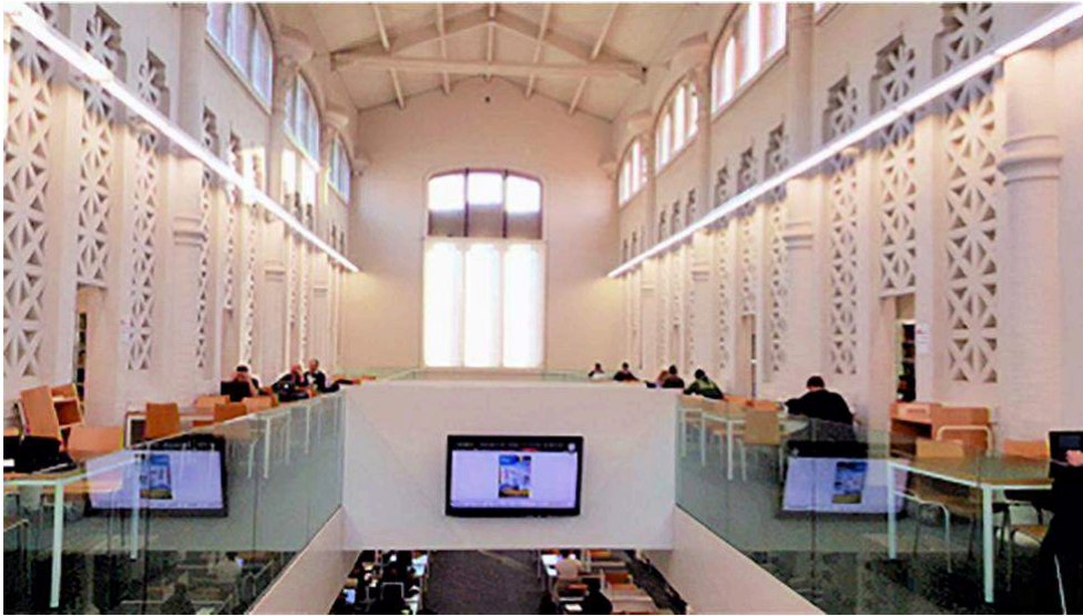
Figure n° 14 : Manresa, La Bibliothèque universitaire, réhabilitation du bâtiment moderniste des abattoirs municipaux