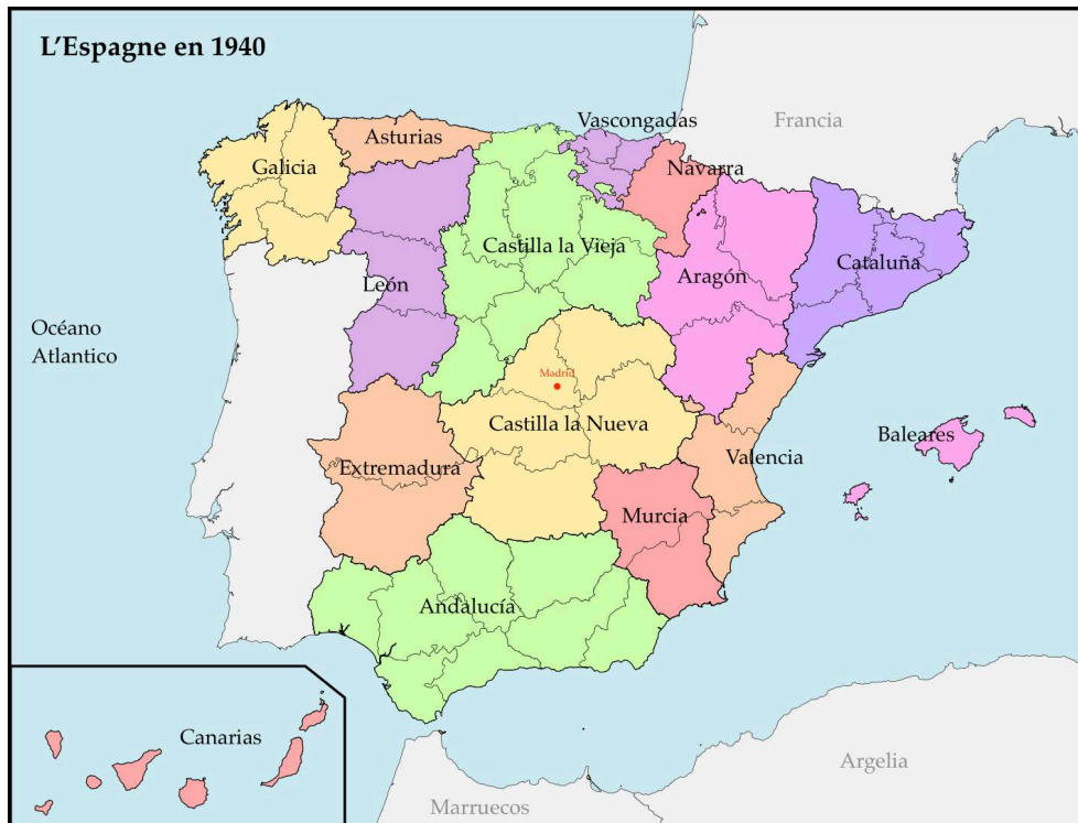
Figure n° 1 : L'Espagne en 1940