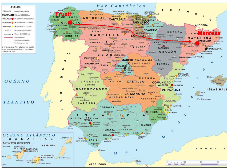
Figure n° 5 : Le trajet de Julia