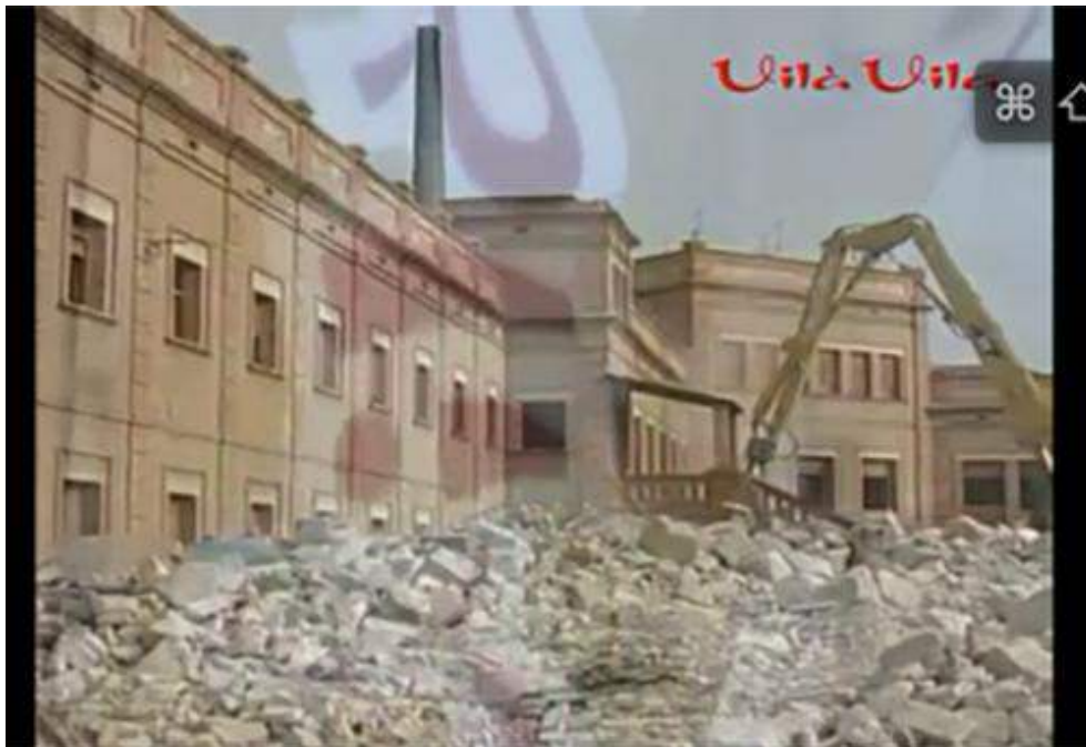
Photogramme du reportage Derribo Fábrica Nova de Manresa , réalisé par Vila Vila Enderrocs, 2013 25 .