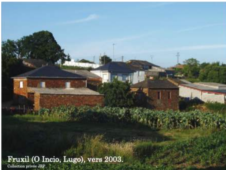
Figure n° 11 : Les bâtisses actuelles de la famille R.P., Fruxil, vers 2003