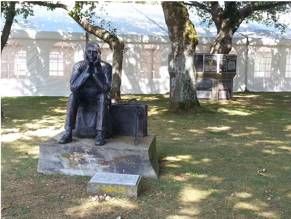
Figure n° 2 : Effigie célébrant la 25ème "Festa do Emigrante" en 2008, à Mosteiro, Consello de Pol, Santiago, 2016.