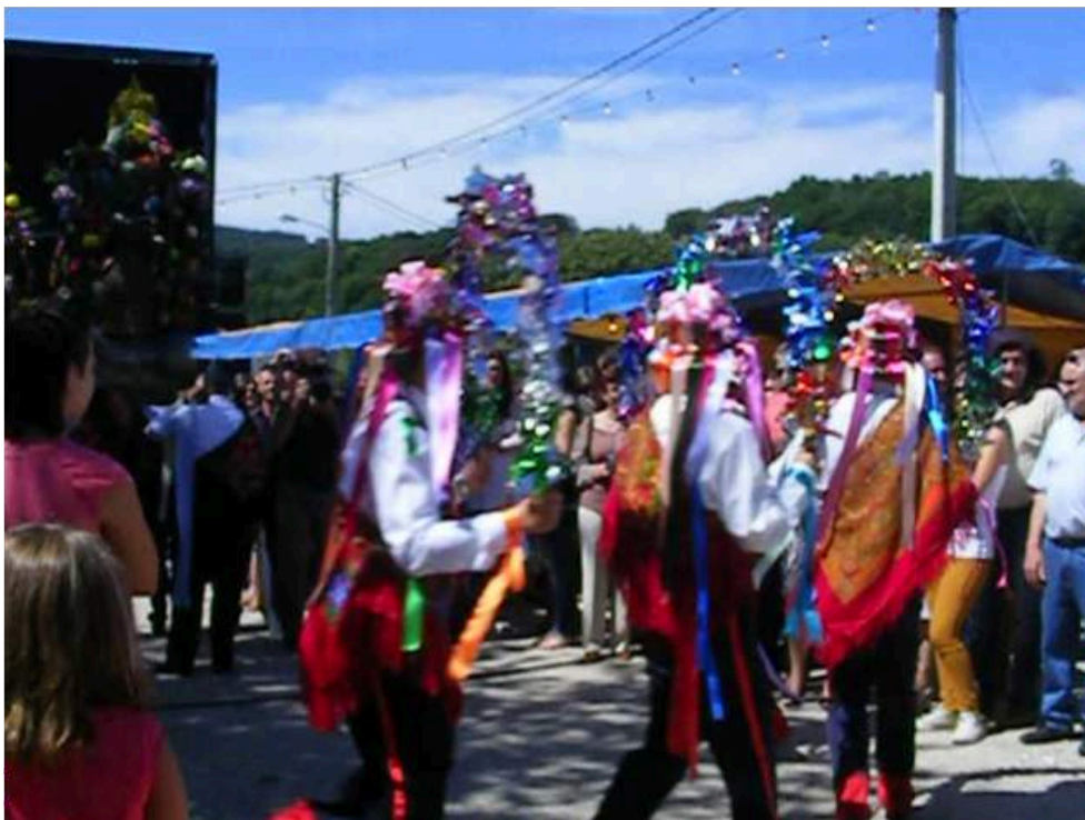
Figure n° 12 : Danzantes , lors de la "fiesta mayor", la fête du village, 2016