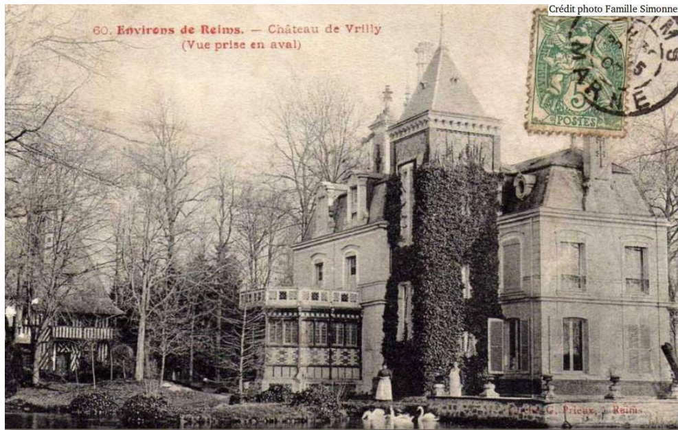
Figure n° 9 : Le Château de Vrilly, carte postale ancienne