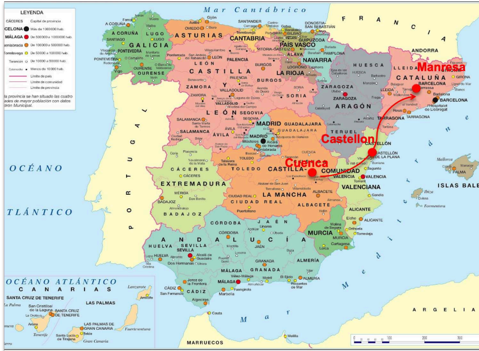
Figure n° 7 : Le trajet de José