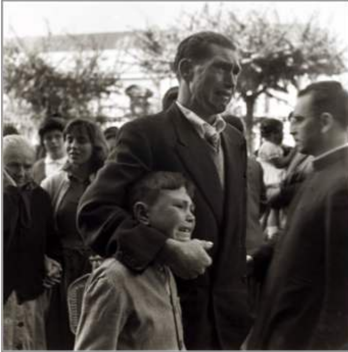
Figure n° 3 : Un père et son fils se séparent d'un familial qui émigre, Port de La Corogne, 1957