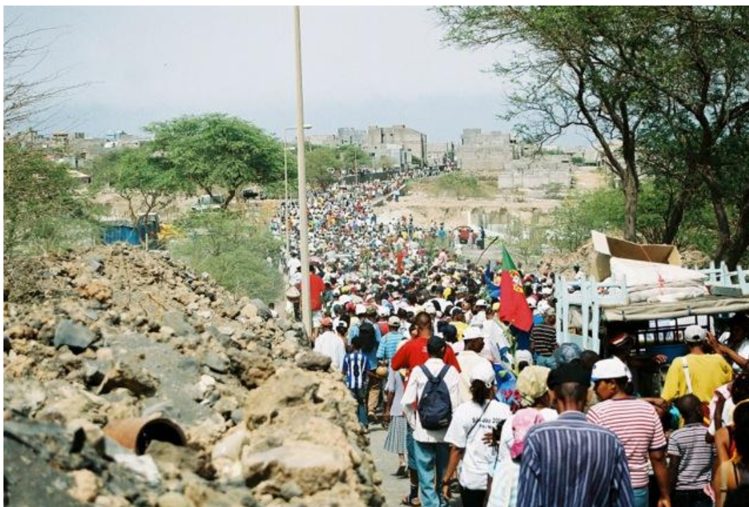
IMAGEM 2 - ENTRADA DA PEREGRINAÇÃO DA FESTA DE SÃO JOÃO EM PORTO NOVO

A peregrinação tem início por volta das 8 horas da manhã. Centenas de pessoas participam nesta jornada na qual os tamboreiros tocam e as pessoas dançam, rodeando a imagem do santo que é transportada num andor e adornada com rosários e com flores. A jornada tem paragens obrigatórias durante as quais se partilha comida e bebida. Depois de cerca de 22 km, o cortejo para à entrada da localidade de Porto Novo, acolhendo as pessoas que o esperam. O grupo de peregrinos, agora reforçado, prepara então a entrada na cidade conferindo-lhe um perfil quase triunfal.