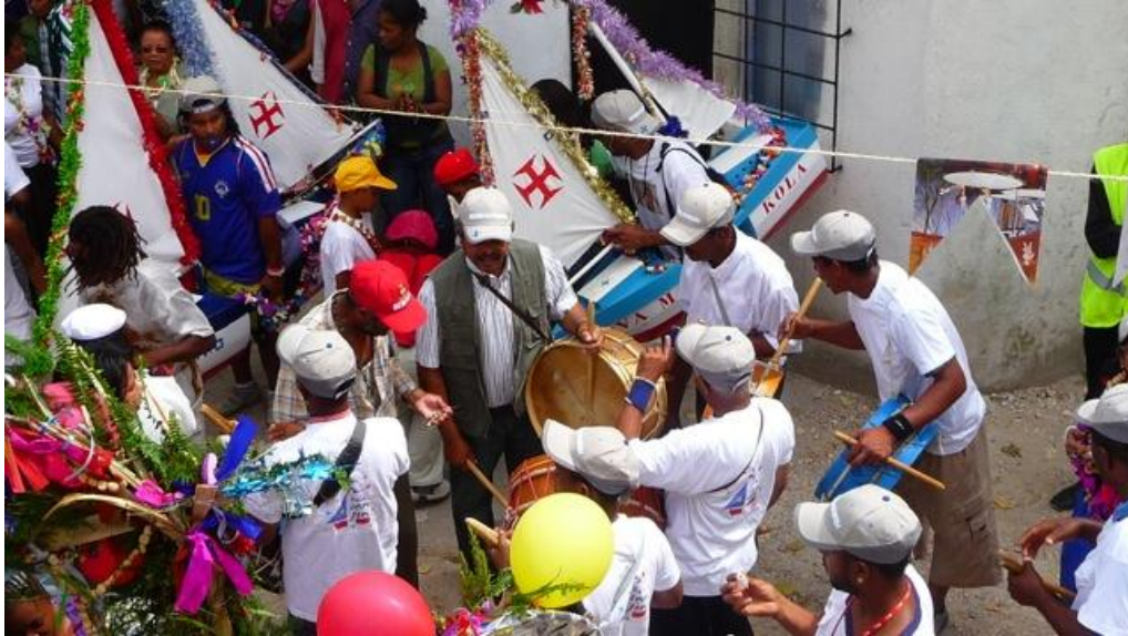
IMAGEM 3 – Cortejo da Festa de Kola San Jon no Bairro da Cova da Moura

27 de junho de 2009