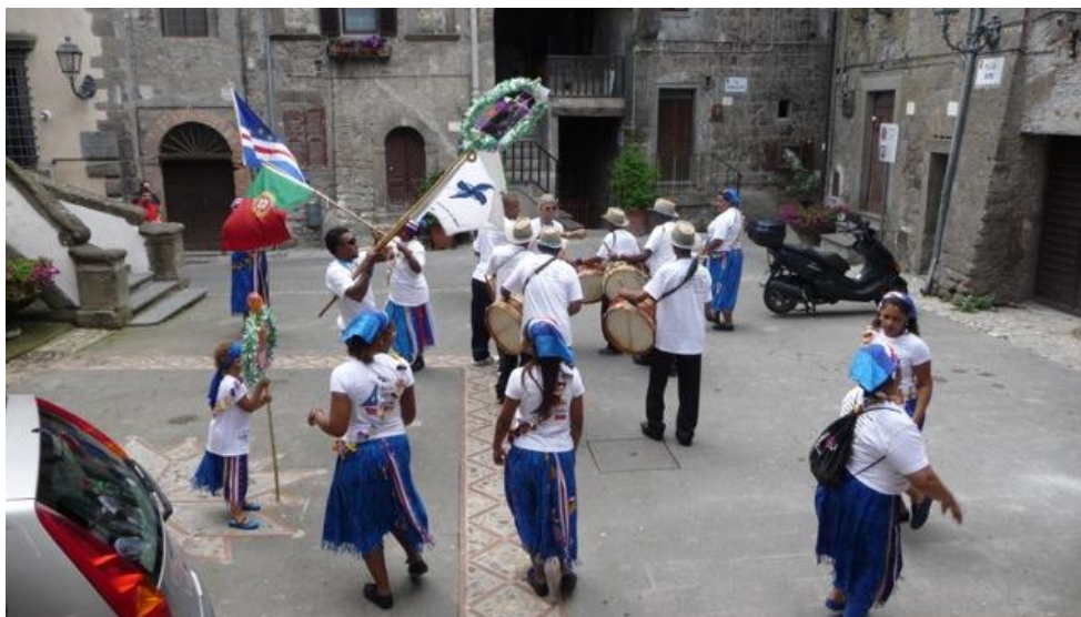
IMAGEM 1 – Grupo de Kola San Jon na praça em frente ao Palácio Orsini, Bomarzo, Itália