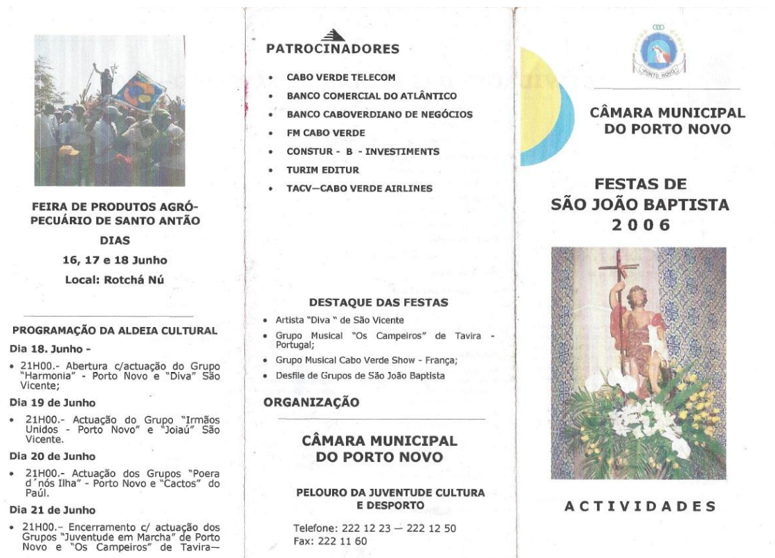
FIGURA 1 – Desdobrável com o programa de divulgação das Festas de São João, em Porto Novo, Santo Antão, 2006

que acontece numa praça da cidade, os grupos de koladeiras 6 dançam ao som dos tamboreiros (tocadores de tambor). As koladeiras destacam-se dos outros participantes no evento pelo vestuário, e porque a forma exuberante e intensa como dançam inibe os outros participantes de se juntarem à performance ativa.