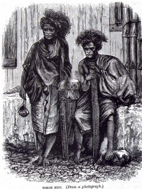
Figura II: “Homens de Timor”. No livro de Wallace, esta ilustração de timorenses acentuava características físicas tipicamente “negróides”: a pele negra, o cabelo crespo (Wallace, 1869: 150).