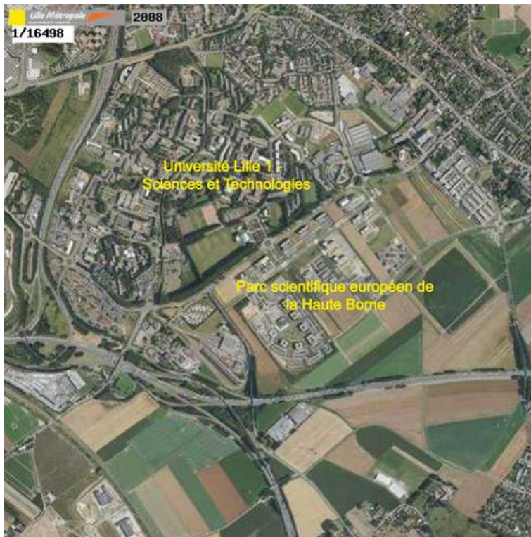
Photographie 1 - La proximité entre l'Université Lille 1 – Sciences et Technologies et le Parc de la Haute Borne

Annotations : L. Malaterre-Vaille, 2010