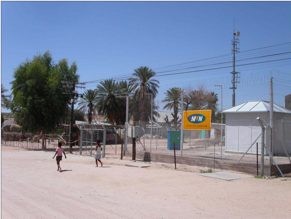
Illustration 1 – Pella