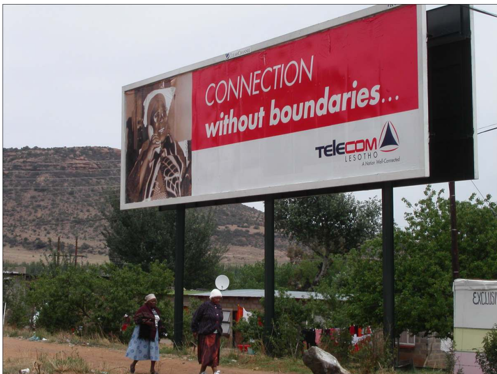
Auteur : Frédéric Giraut, 2003.