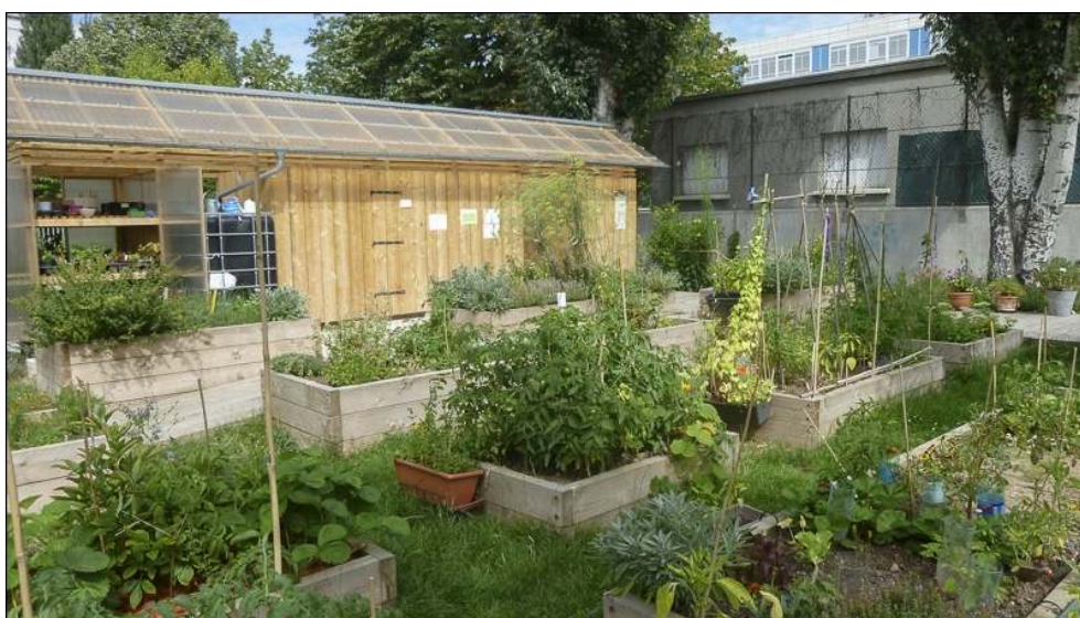
Auteur : K-E. Demailly, août 2012.

Illustration 4 - Le jardin du Clos Garcia : un « atelier d'urbanisme utopique » mené par le collectif Bruit du Frigo