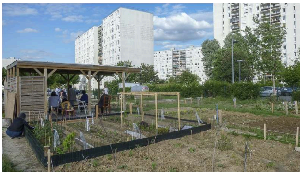
Illustration 5 - Le jardin éphémère du quartier des Beaudottes, bien installé...