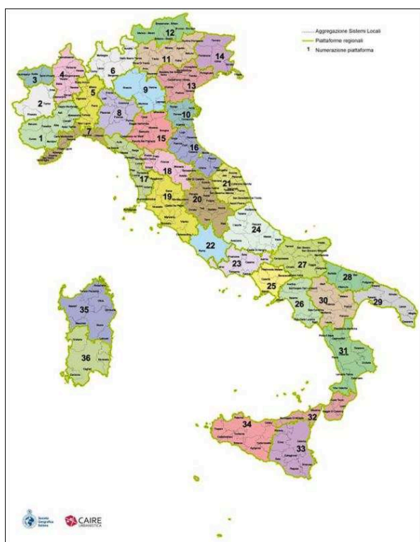
Illustration 3 – Une des hypothèses de remaillage régional proposée par la Società geografica italiana (2013)

limite en gris : regroupement des systèmes locaux limite en vert : plates-formes régionales (numérotées)