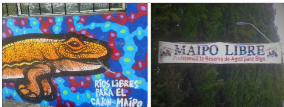
Illustration 4 - Visibilité de l'opposition dans les espaces publics

À gauche, une peinture murale au cœur de la capitale, réclamant « des eaux libres pour le Cajón del Maipo ». À droite, une banderole dans la commune de San Jose de Maipo, incitant à « protéger la réserve d'eau potable pour Santiago ».