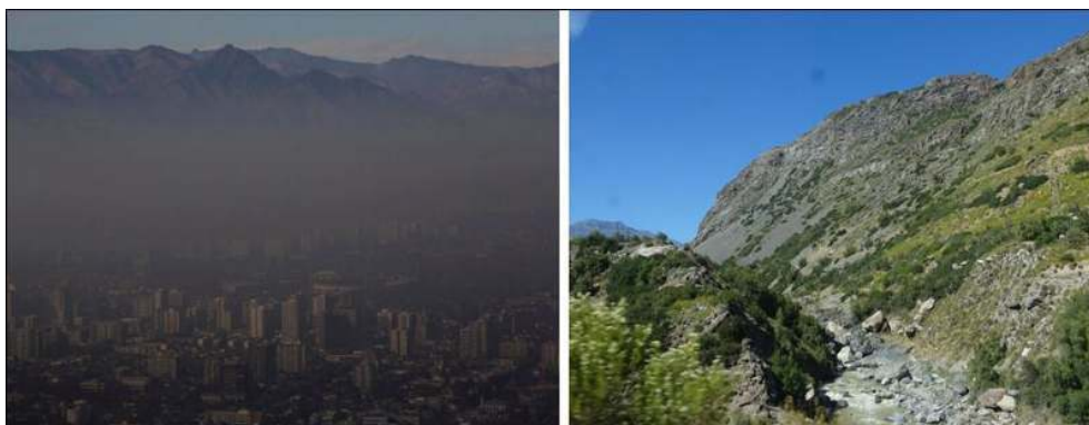
Illustration 3 - Santiago, étouffée par le Smog, cherche sa respiration dans le Cajón del Maipo