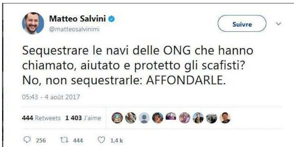
Illustration 4 – Tweet de Matteo Salvini, leader de la Ligue du Nord

Dans un tweet liminaire, le secrétaire fédéral de la ligue du Nord, Matteo Salvini, déclare : « Séquestrer le bateaux des ONG qui appellent, aident et protègent les passeurs ? Non, il ne faut pas les séquestrer, il faut les COULER ».