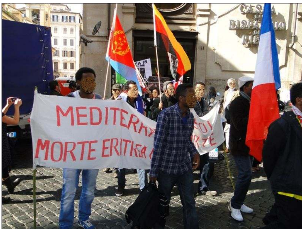
Illustration 2 - Manifestation des Érythréens à Rome à la suite du naufrage du 3 octobre, qui provoqua 368 morts

Les visages sont floutés pour protéger l'anonymat des participants.