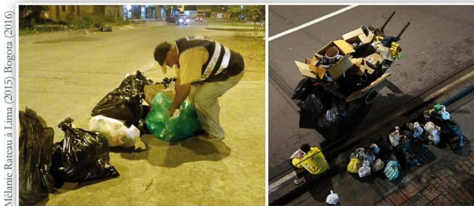
Illustration 3 - Récupérateurs informels à Lima (à gauche) et à Bogota (à droite) ouvrant les sacs poubelles à la recherche de déchets recyclables