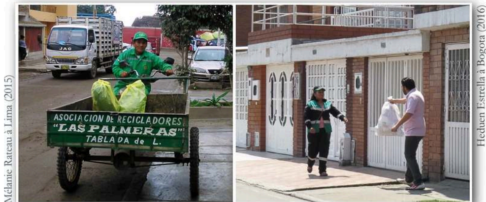
Auteurs : M. Rateau, Lima, 2015 (gauche) ; H. Estrella, Bogota, 2016 (droite)