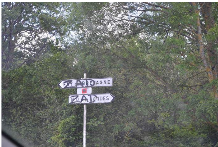
Figure 1 : La zad s'inscrit dans le territoire à travers une signalétique 7

Cette rencontre avec l'autre n'est pas sans contraintes. Celles-ci peuvent être physiques. Les terrains regorgent d'entraves aux mouvements et à la circulation du chercheur. Les portes, les barreaux, les couloirs, les pièces sombres, les PC sécurité, les plexiglas, les boîtiers sécurité, les chaises de la prison, au même titre que les barrages de gendarmerie, les barricades, les chicanes, les fossés, les haies et les clôtures de la zad forment des barrières et des étapes que le chercheur doit surmonter pour accéder à son objet d'étude (Figure 2). Garants de la sécurité et de la distance sociale, ces dispositifs contribuent à fabriquer les émotions et les sensations que le chercheur ressent à travers son parcours.