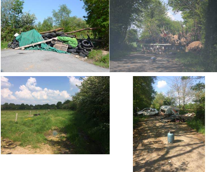
Figure 2 : Barricades, fossés, clôtures, entre protections et entraves 9

Carnet de terrain de Julien Gaillard (5 mai 2018)