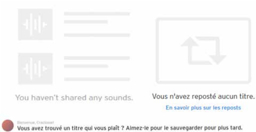
Figure 5 : injonctions à contribuer et à partager sur SoundCloud (juillet 2016)

Les moteurs de recommandation s'appuient sur la rationalité des écritures documentaires qui est de trois ordres : la référence, la catégorie, la relation. Alors que, dans l'écoute, il n'y a pas (toujours) cette rationalité, cette intentionnalité supposée, mais le goût de l'exploration, de la découverte, les systèmes de recommandation font l'hypothèse que pour des pratiques d'écoute similaires (enchaînement des morceaux dans l'écoute, choix des genres préférés, constitution de playlists), il y aurait des goûts, des désirs similaires. C'est pourquoi les enquêtés se montrent souvent critiques quant à la reproduction du même : se voir proposer sans fin des morceaux qui sont à l'identique des profils d'écoute déjà renseignés. La plupart d'entre eux perçoivent la recommandation automatisée comme un dispositif commercial, dont ils se méfient, et ceci même lorsqu'ils en reconnaissent la pertinence des suggestions.