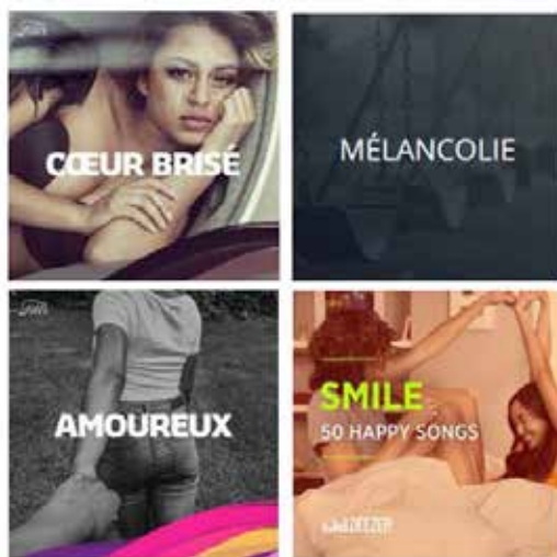
Figure 2 : textualisation du registre des émotions (de mai à juillet 2016)