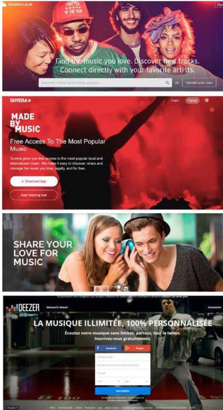
Figure 4 : sémiotisation des pratiques sociales associées à la musique (de mai à juillet 2016)