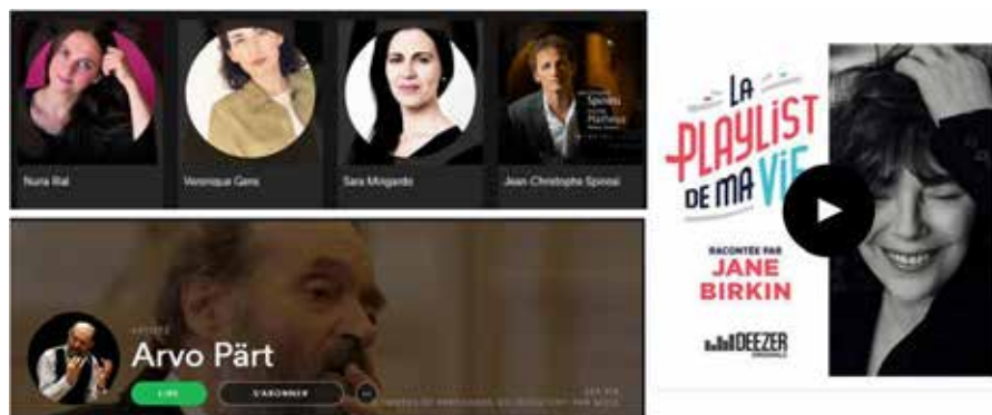
Figure 6 : sémiotisation de la rencontre avec des artistes (juillet 2016 et mars 2017)

Montrer que les propositions de navigation et d'ouverture à d'autres morceaux émanent d'institutions reconnues socialement comme des lieux de savoir, permettrait de reconstituer le cadre de confiance que représentent ces différents « lieux de pratique » (Després-Lonnet, 2014) de la musique et d'instaurer une forme de dialogue avec des spécialistes, que les auditeurs associent à des sphères de compétences identifiables, qu'il s'agisse de la gestion de la discothèque de Radio France, de l'indexation des ressources documentaires de la BNF ou encore de l'archivage des concerts de la Philharmonie de Paris. Là où les sites de recommandation tentent de recréer artificiellement une forme de lien social en sémiotisant des figures d'amateurs, d'artistes ou de médiateurs (cf. figure 6), l'affichage de l'identité institutionnelle des médiateurs permettrait de rééquilibrer la communication et d'engager l'auditeur dans une forme de dialogue avec des acteurs, socialement rattachables à l'un de ces lieux de savoir.