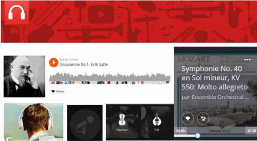
Figure 1 : la sémiotisation de la matérialité (captures d'écran réalisées entre mai et juillet 2016)

de la musique, sa force, son énergie sont signifiées dans des manifestations visuelles de sa durée, de ses ondes, de ses flux. La sémiotisation de la collection, du « stock » disponible chez soi et chez les autres, est aussi une (re)mise en matérialité de la musique numérique, qui est également montrée comme « jouable », jouée ou rendue « audible » grâce à des dispositifs d'enregistrements, des dispositifs d'écoute, des instruments, des interprètes (cf. figure 1).